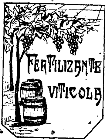
Patente núm. 85.896