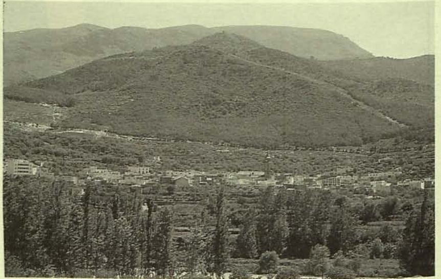
EMPLAZAMIENTO DE FONDÓN.

El actual municipio de Fondón fue dividido en dos concejos: Codba (Fuente Victoria) en el que se establecen 79 repobladores que reciben 109 suertes (cada una de las cuales está formada por una vivienda, quince barchelas y media de tierra de riego y seis fanegas y media de secano)