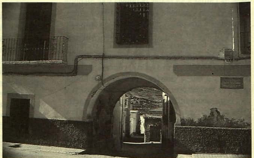
FONDÓN. AYUNTAMIENTO.