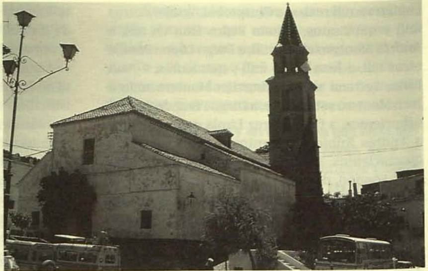
FONDÓN. IGLESIA DE SAN ANDRÉS.

Ante la pregunta sobre el origen del dinero