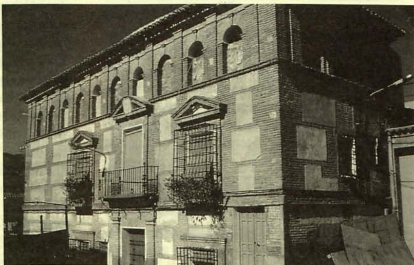
FONDÓN. CASA DE LOS GODOY.