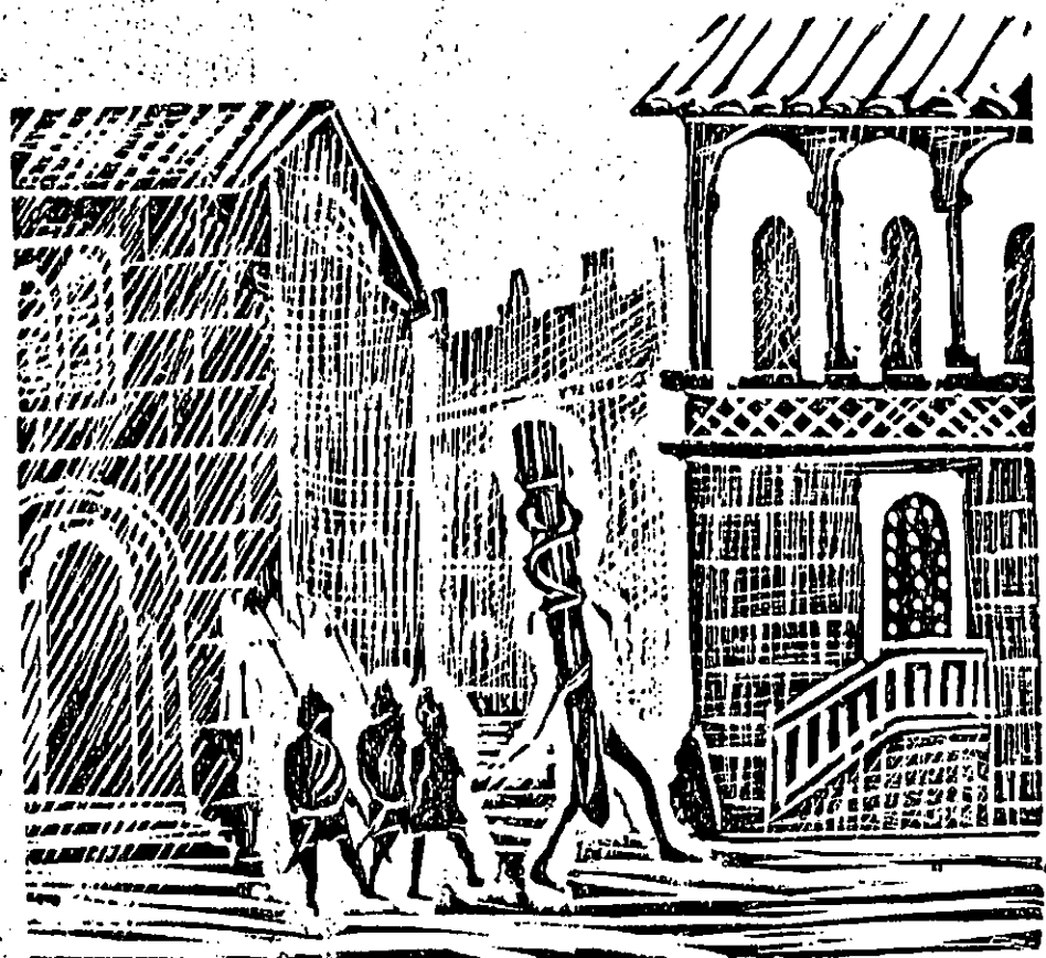
La vara de la Alcaldía va de Herodes á Pilatos

ellos se lavan las manos... y el pueblo es quien paga el pato.