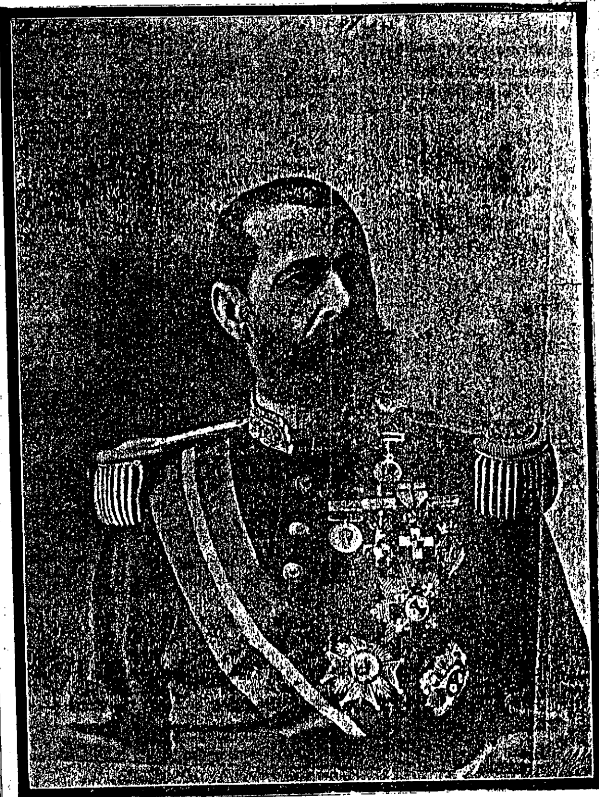
Nació en Cuevas el 16 de Julio, 1845 † en la misma ciudad el 7 Octubre 1905.