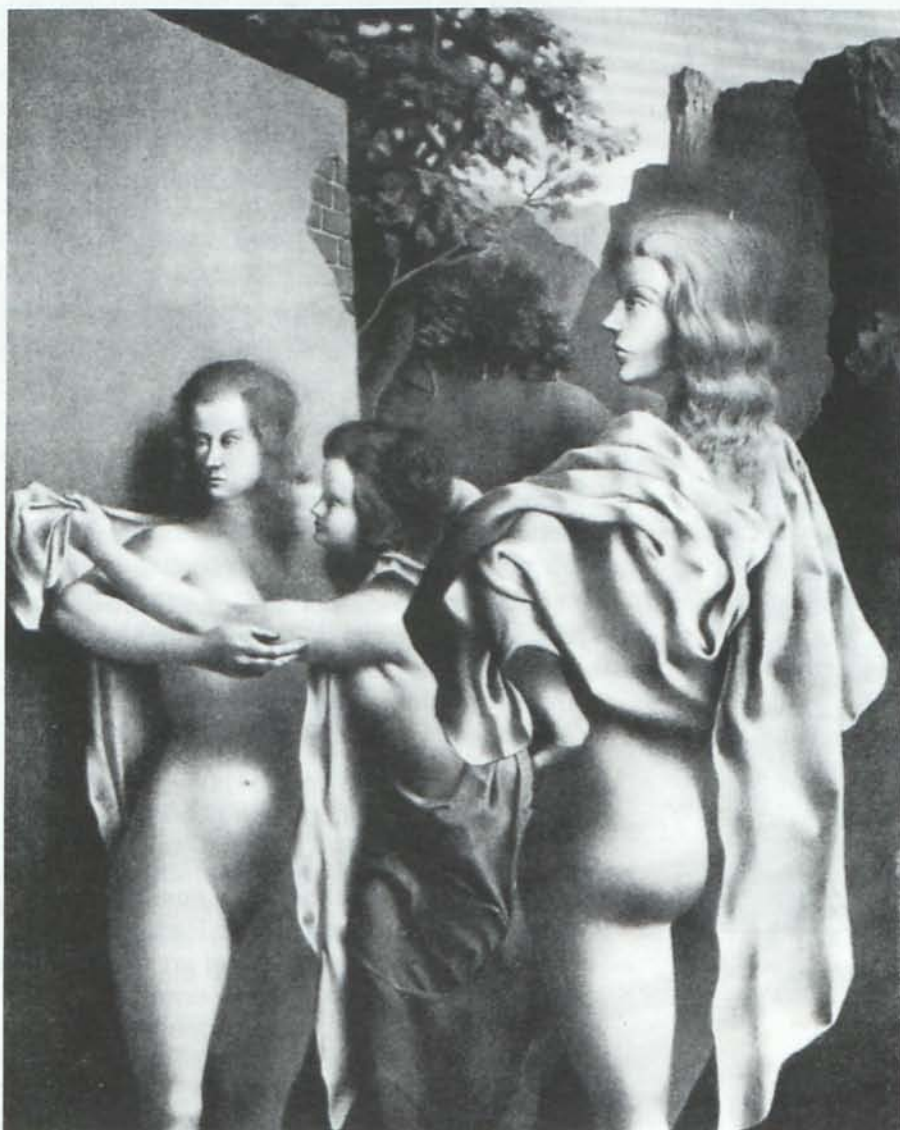
Obra con una gran influencia clásica realizada en 1939, publicado en Fernández de Capel (2006) "Federico Castellón: análisis de las litografías". Almería, IEA.

Lo más conocido de Federico Castellón son sus litografías, pues le dedicó mucho tiempo, a pesar de ello, no le impidió practicar otras técnicas.