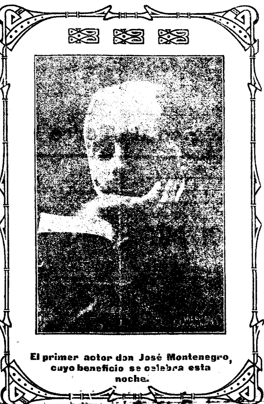
El primer actor don José Montenegro, cuyo beneficio se celebra esta noche.