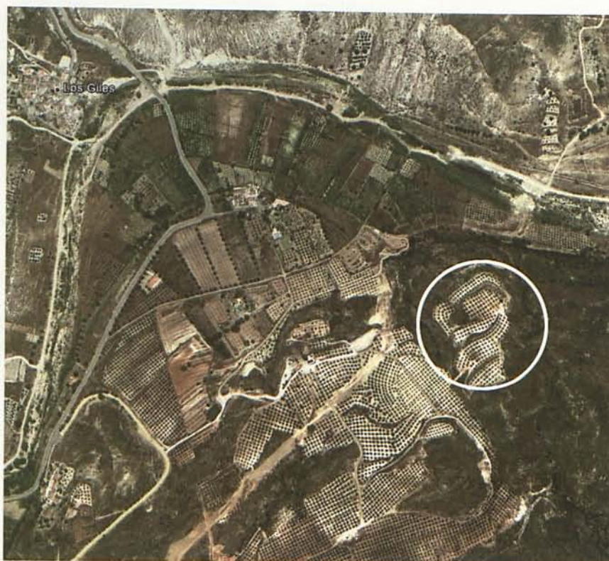
Vista por satélite del lugar donde se ubicaba el complejo funerario de El Gemio.

Se llega al lugar cogiendo la salida Los Giles-La Huelga de la autovía a Almería y, tras cruzar el cauce del río Aguas, a la altura del cortijo Los Cazadores, dirigirse a la izquierda en dirección Este. Las coordenadas geográficas son UTM 890091 T. M. Turre. Altura relativa 190 m. sobre el nivel del mar.