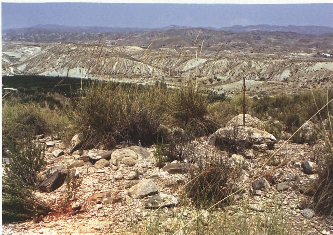
Foto 2: Acumulación de piedras formando muro, cercana al enterramiento megalítico.

servamos restos de una estructura en forma de muro (foto 2) próxima al enterramiento, que coincidiría con el descrito por Algarra.