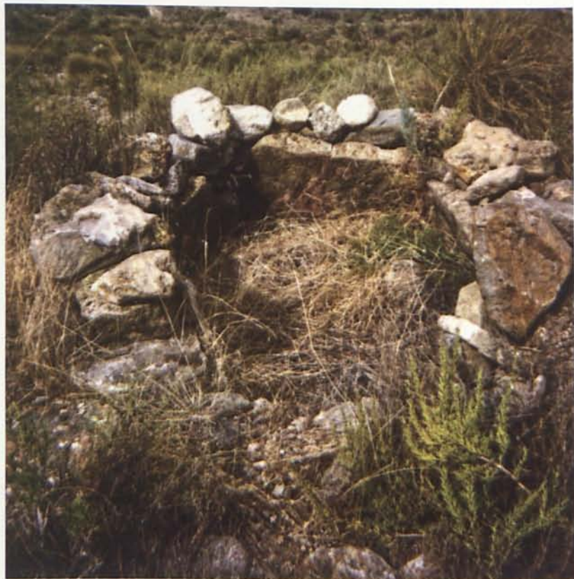
Foto 1. Sepultura de El Gemío. Obsérvense los ortostatos originales de la estructura bajo las piedras añadidas en tiempos recientes para su uso como puesto de caza.

Este topónimo da nombre a un promontorio que se eleva sobre la margen derecha del río Aguas y al barranco que confluye en él, llamado de Los Quemadillos en los mapas 2 , a unos 500 metros al Este del cortijo de Los Cazadores –o venta del Cazador–. En la prospección arqueológica llevada a cabo en 1989, en la que participé bajo la dirección de Domingo Ortiz Soler, sobre el –entonces futuro– trazado de la autovía Murcia-Almería, en el tramo Los Gallardos-Venta del Pobre (Níjar), localizamos esta sepultura de planta poliédrica hexagonal, que ya fue estudiada por Algarra 3 a principios de los años 50 del pasado siglo. Así describía el hallazgo: « El Gemío es una zona de sepulcros megalíticos, conservándose uno en buen estado, formado por grandes piedras calizas, colocadas