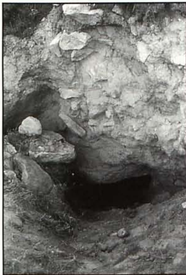
Láminas 6, 7 y 8. Las dos primeras son cistas excavadas por Cuadrado tal y como permanecerían a fines de los setenta y la tercera es una laja de otra posible.

cista de doble inhumación era que sobre las piernas de los inhumados se encontraron unos tablones de madera (fig. 1) (Ayala, 1986, p. 35, f. 5).