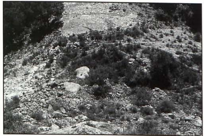
Lámina 5. Posible aprisco similar a los del Oficio, La Bastida e Ifre.

Entre los restos materiales obtenidos en su trabajo de campo, Cuadrado constató el desarrollo de una abundante agricultura cerealística pues halló siete molinos dispuestos en su taller de molienda de variados tamaños. La caza también está documentada a través de un colmillo de jabalí y los restos óseos de un asta de cérvido que, tan sólo se ha observado, hasta la fecha, en este poblado y en El Cerro de las Viñas de Coy con una diferencia entre ambos hallazgos de cincuenta y un años. Entre los restos óseos de fauna también constató la presencia de felinos.