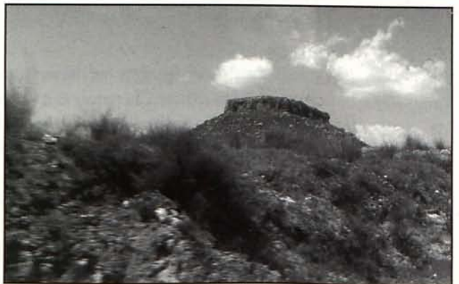
Láminas 2 y 3. Vista general del poblado de La Almoloya.