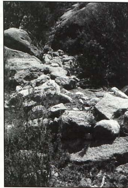
Lámina 4. Pasadizo angosto de acceso a la cima salpicado de escalones aislados.

La actividad económica se manifiesta a través de las actividades ganaderas, cinegéticas y comerciales que se documentan a través de los hallazgos fabricados en las diáfisis óseas de la fauna doméstica y salvaje como son los útiles de adorno, cuentas de collar y puntas de flecha.