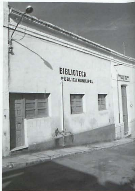
Imagen de la biblioteca municipal inaugurada en esta legislatura.

Unos meses más tarde, todos los concejales acordaron por unanimidad, a petición del alcalde, renunciar a las asignaciones económicas que según la ley pudieran corresponderles, igual que a los gastos de viajes, dietas o cualquier otra remuneración contemplada en el Real Decreto 18 1531/1979 para destinar ese dinero a incrementar las partidas de índole social o benéfica 19 .