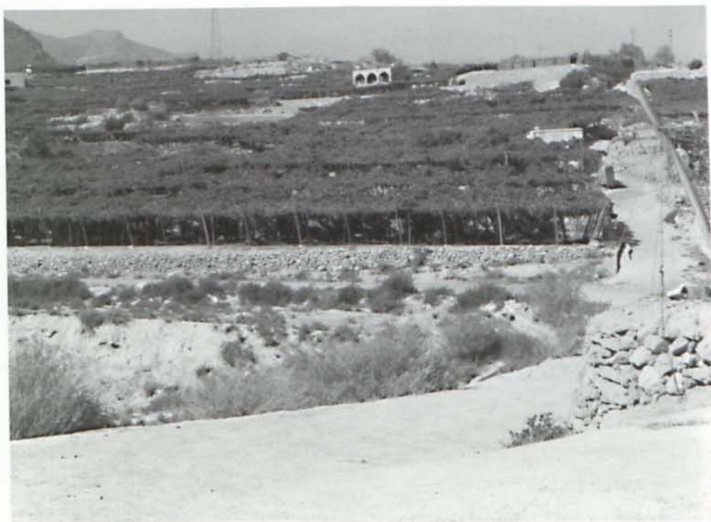
Imágenes de la vega de Alhama cubierta de parras.

La agricultura -con el fomento del cooperativismo, tanto dirigido a la comercialización de la uva como a la compra de los abonos e insecticidas necesarios para el cultivo- junto a la mejora de los servicios e infraestructuras en el pueblo constituyó el eje de su programa electoral.