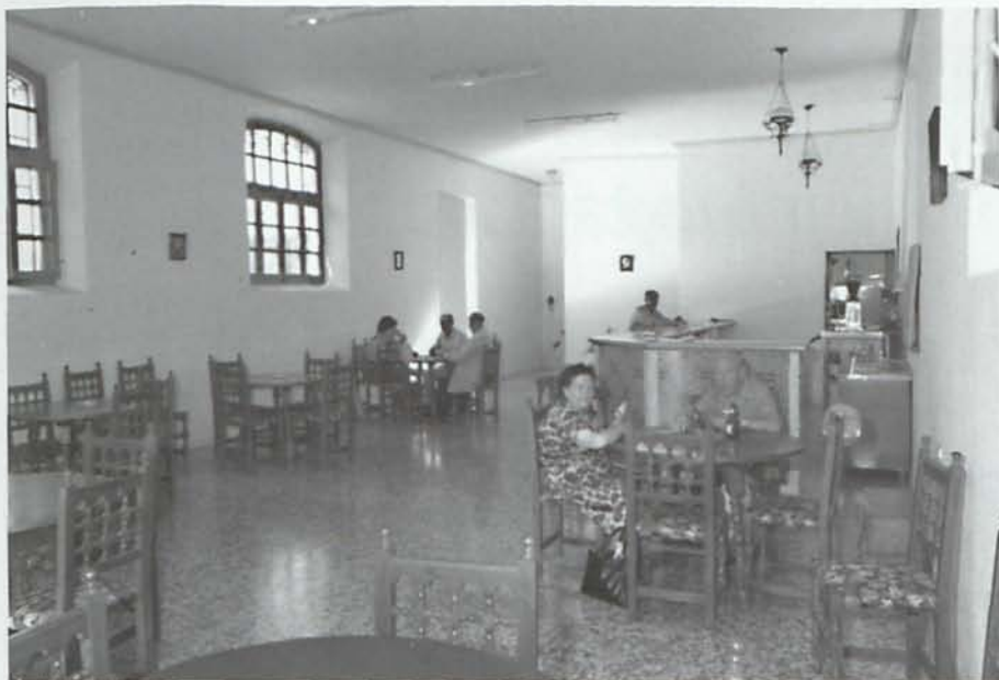
Interior del Centro Social de mayores en la antigua escuela de don Gaspar. Col. particular José Antonio Picón García.

El estudio de las actas de pleno correspondientes a esta primera legislatura de la democracia pone de manifiesto la intensa actividad desarrollada, dado el abultado número de proyectos que se llevaron a cabo en estos años. De una parte, los relacionados con la agricultura y con la grave crisis que la uva del barco atravesaba -recordemos la catástrofe acaecida en el verano de 1978 cuando una terrible ola de calor quemó prácticamente toda la cosecha o bien aquellas asambleas de parraleros que culminaron con la manifestación de los agricultores en el Paseo de Almería protestando por los bajos precios de la uva y por las dificultades de su comercialización. De otra, la puesta en marcha de un programa de infraestructuras que mejorara las graves carencias que Alhama tenía, especialmente en materia de alcantarillado, en el adecentamiento de calles, y en la necesidad de nuevos servicios de índole cultural, educativos y sociales.