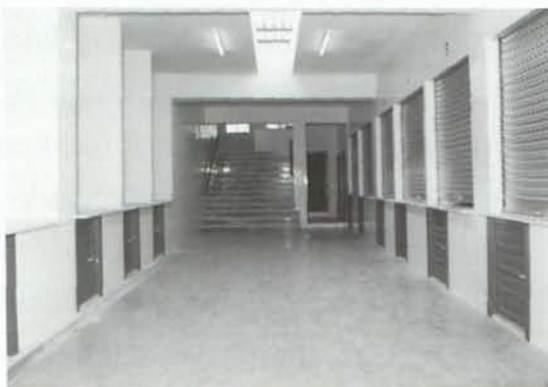
Interior del mercado de abastos con sus dos plantas totalmente renovadas. Planta inferior destinada a la venta de carnes, frutas y verduras. Planta superior para los pescados.

En definitiva, fueron años de mucha ilusión y de trabajar sin desmayo por la mejora del pueblo, porque tal como afirman alguno de lo protagonistas de esta historia: todo estaba por hacer y aunque la experiencia era escasa, las ilusiones y las ganas de trabajar por Alhama, suplieron todas nuestras carencias.