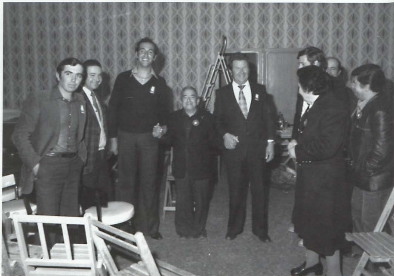
Los miembros de la candidatura del Partido Socialista Obrero Español preparando uno de sus mítines en Alhama.

La candidatura socialista alhameña, centraba su mensaje en la necesidad de gobernar los ayuntamientos desde la transparencia y la honestidad, abogando por una mayor participación de la sociedad alhameña en la gestión municipal.