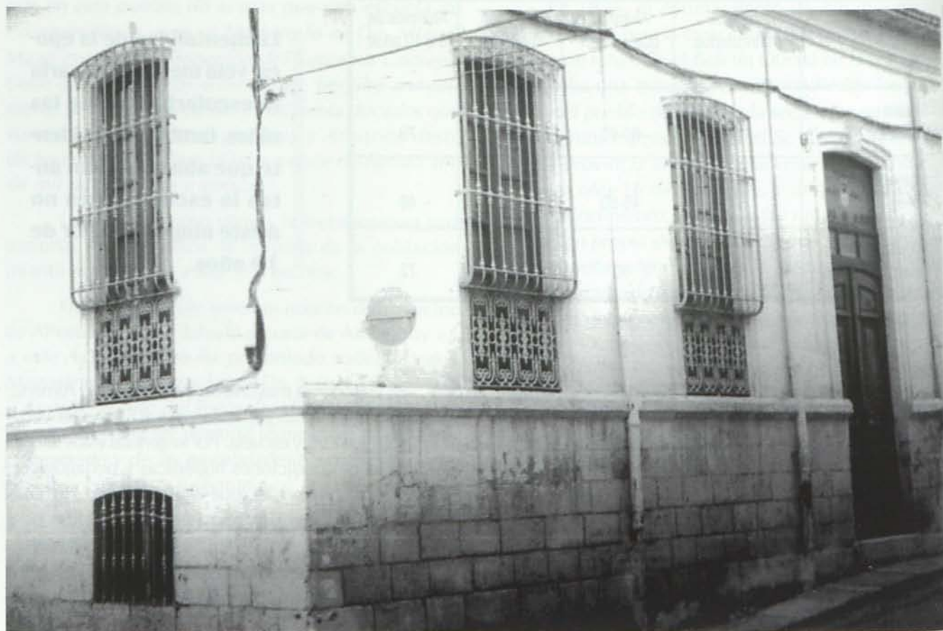
Fachada del edificio donde posiblemente se ubicara el Colegio de Segunda Enseñanza de Alhama de Almería