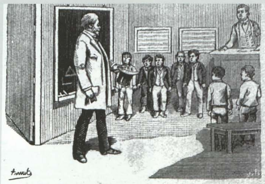
Ilustración de una visita de inspección. Finales del XIX

¿Cuales fueron los resultados de todo este esfuerzo educativo?. Una pista nos la da Pilar Ballarín, en su estudio sobre el analfabetismo en Almería. En 1860 Alhama tenía un porcentaje de analfabetismo del 87,85%. En 1900, el índice de analfabetos había descendido hasta un 60 %, lo que suponía una de las cifras más bajas de la provincia. 24