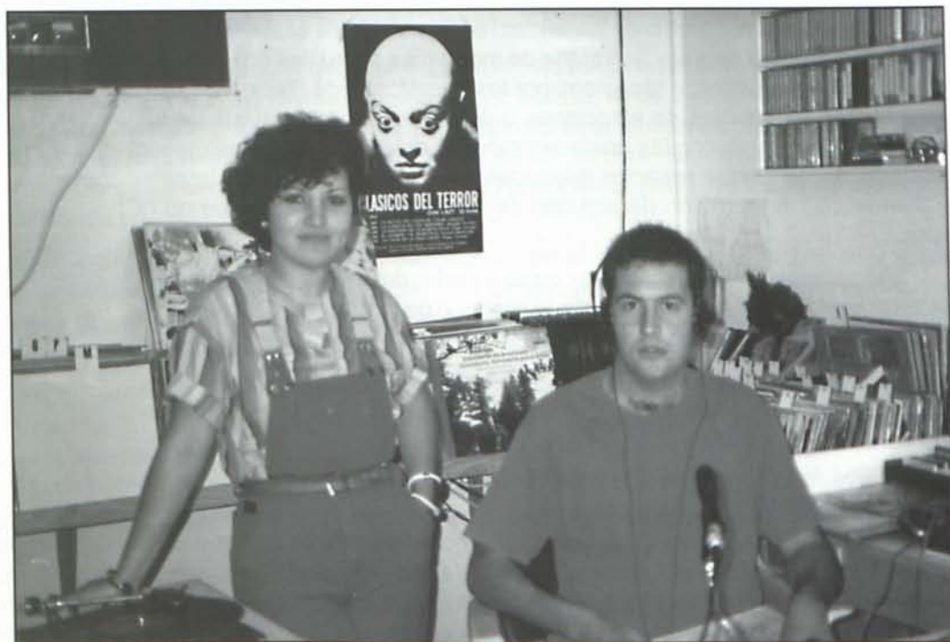
Algunos colaboradores de la emisora hacia 1985.