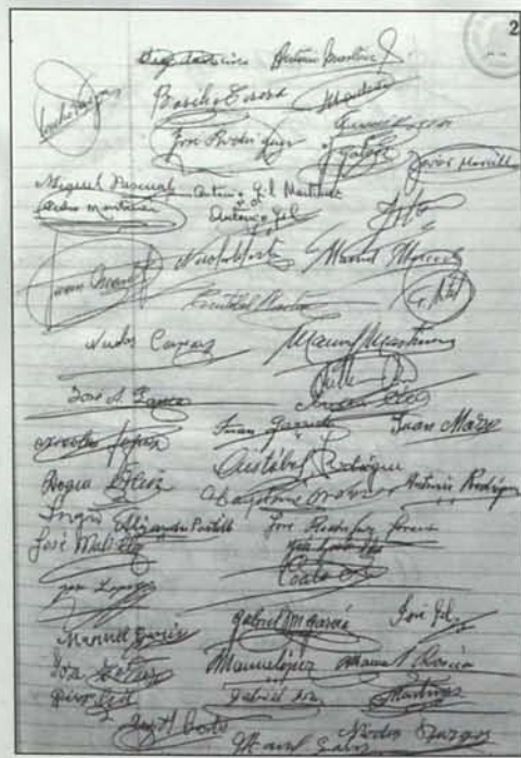
Página de Firmas de los socios, en el Libro de Actas de Asambleas Generales

entre los titulares de participaciones sociales sean o no liberadas por partes iguales.