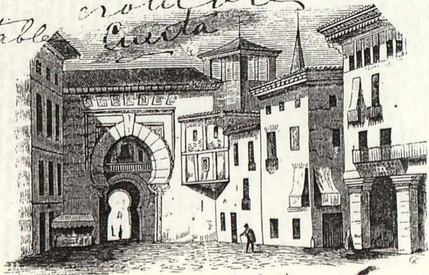
Puerta de Bib-Arrambla en Granada.