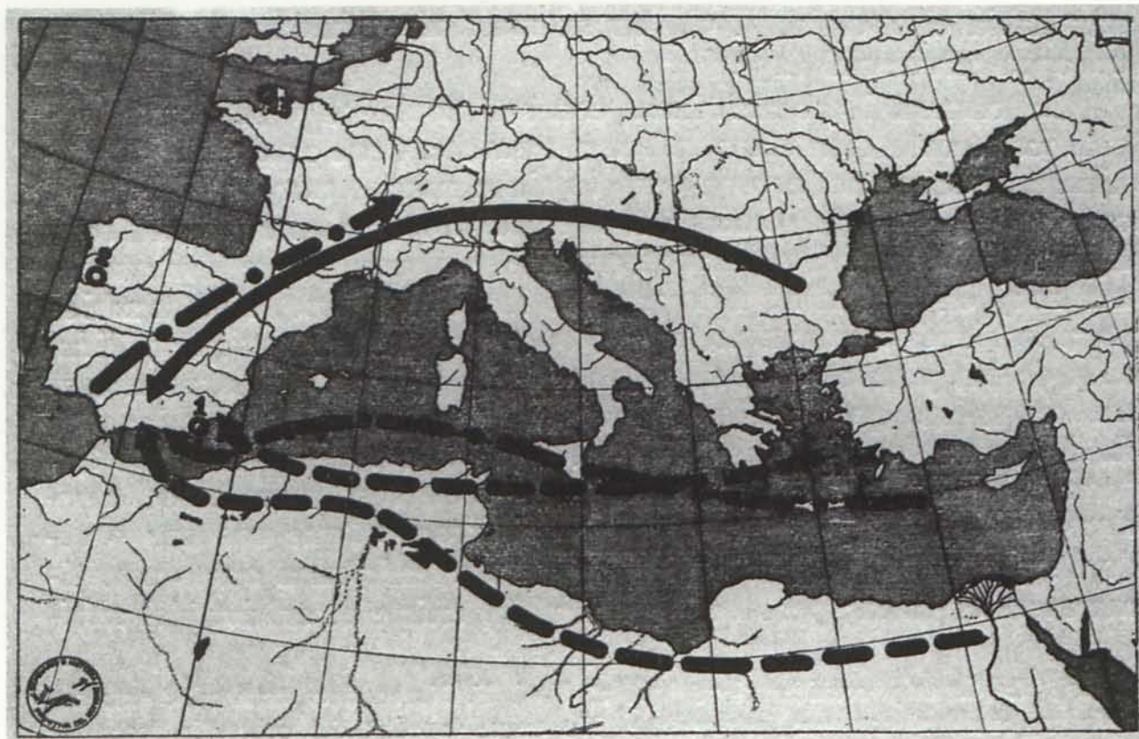
Fig. 3.- Rutas de llegada a la España iberosahariana de cereales y leguminosas: 1. Trazo continuo, triticum vulgare compactum ; 2. Trazo discontinuo, hordeum vulgare exastichum y triticum diccocum ; 3. Trazo de punto y raya, celtica nana . Localidades: 1. Almizaraque; 2. Pepim; y 3. Pinnacle Rock

Anatolia y Egeo, cosa que casi permanentemente se olvida, y que hay que tener muy en cuenta no sólo para lo iberosahariano, sino también para lo hispanomauritano 26 , y que el estudio del origen y difusión de las plantas cultivadas nos puede ayudar a aclarar eficazmente, puesto que con los solos datos que, gracias al cuidado de L. Siret y a los estudios del profesor Neotlitzky, nos brinda el Cabezo del Almizaraque, vemos que hay cultivos, como el del hordeum vulgare exastichum y triticum diccocum , que nos han podido legar tanto por la vía continental norteafricana como marítima mediterránea; pero que, en cambio, existe el cultivo del triticum vulgare compactum y de la celtica nana , que presuponen dos caminos, desde luego ni africano, ni marino mediterráneo uno de ellos.