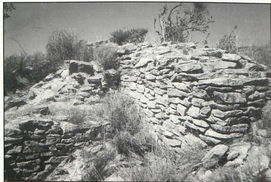
Estado en que se encuentra actualmente el Castillico de Alfaix.