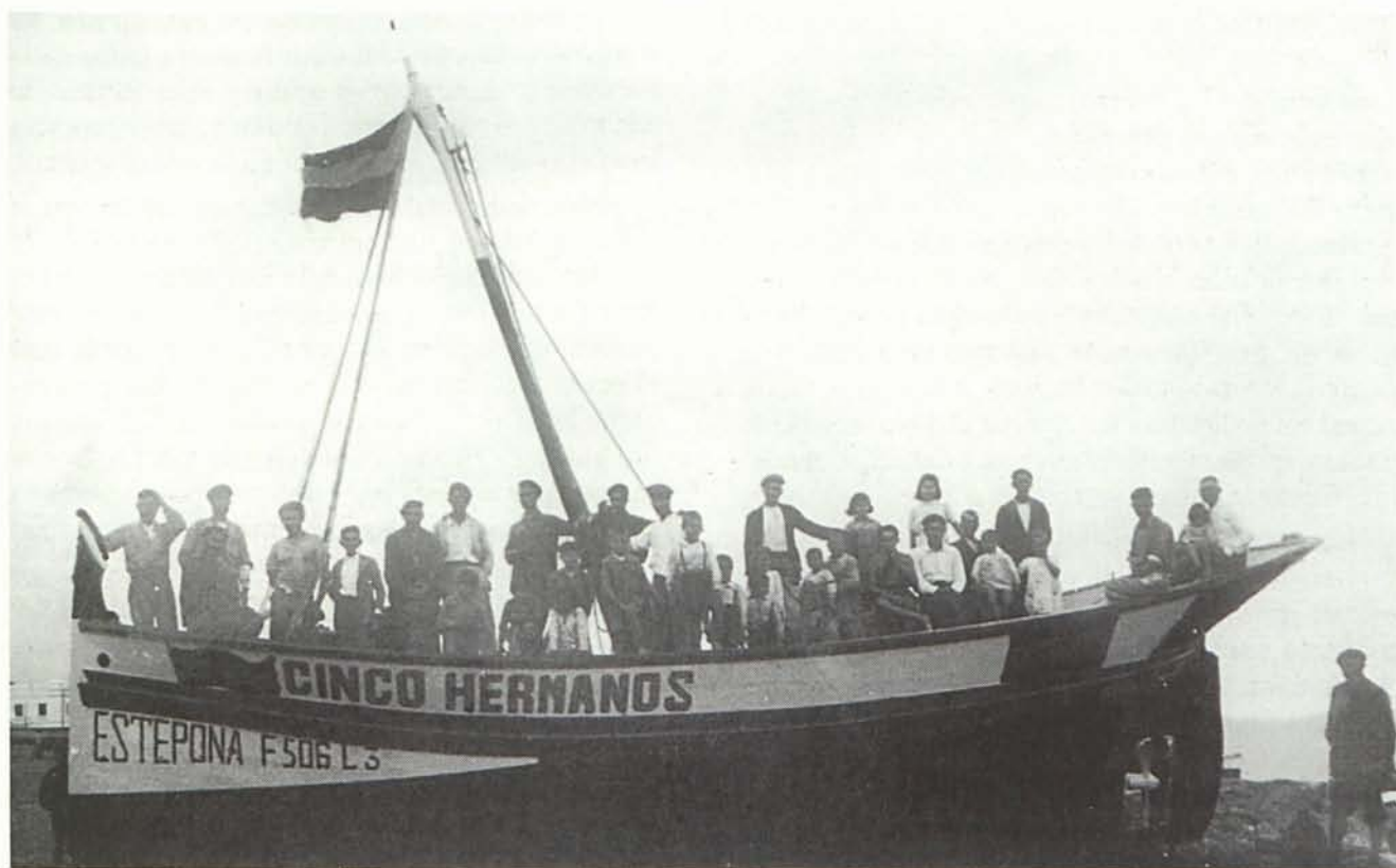
Barco «Los cinco hermanos». Año 1952.

La flota artesanal de Carboneras practica en una determinada época del año la pesquería de