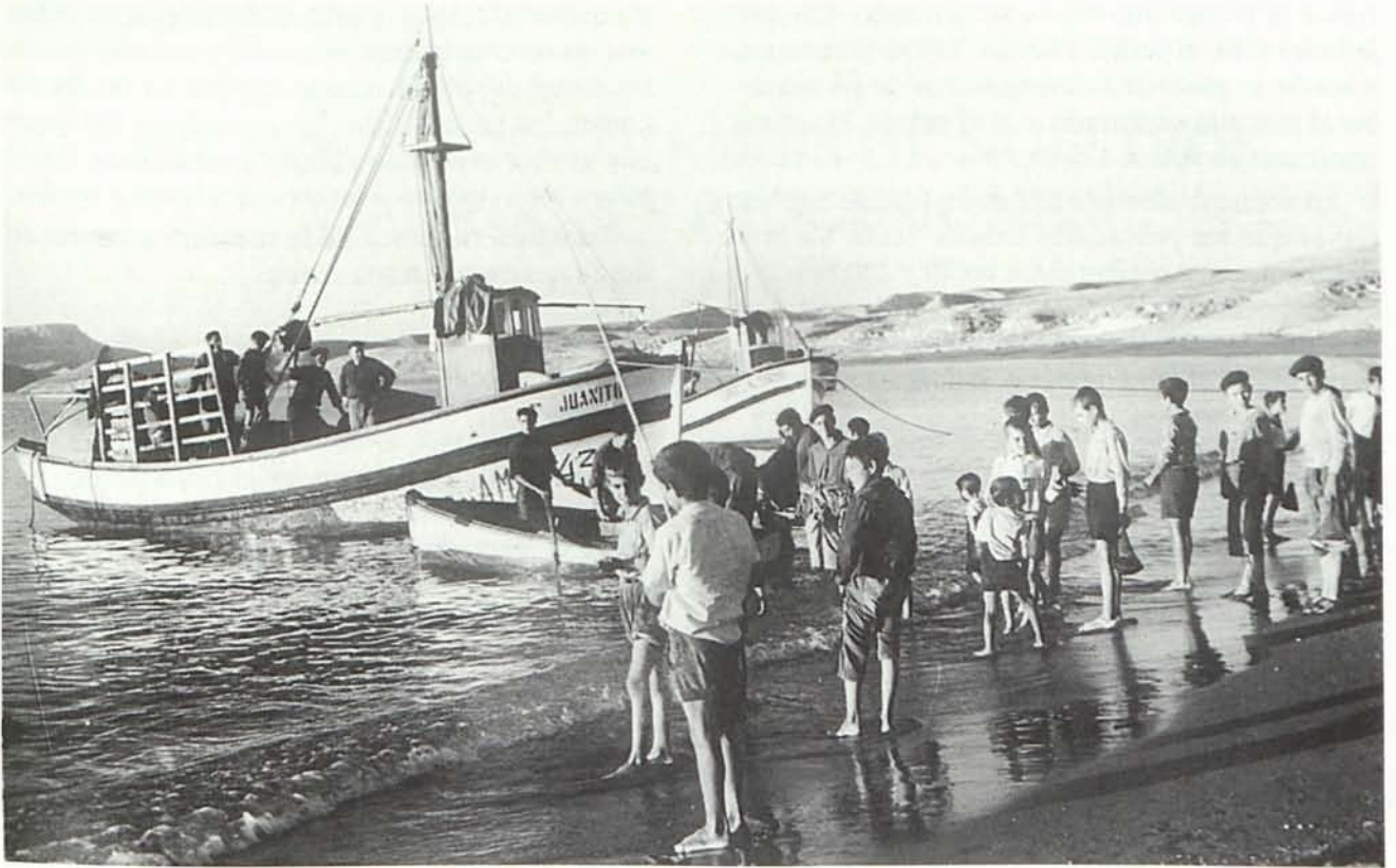
Pescadores en la Playa. Años 50.