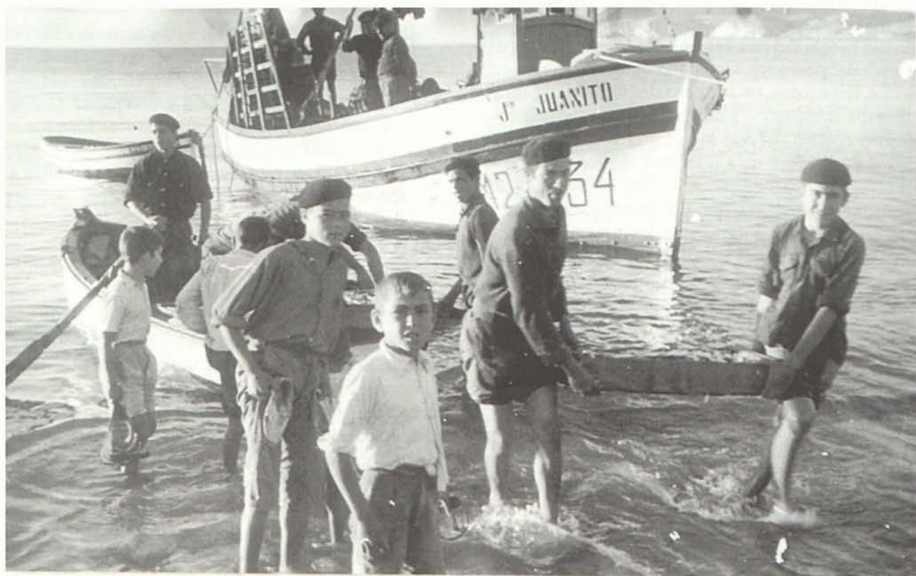
Pescadores sacando el pescado en cajas (Postal años 50, realizada por GIRA).

Se trata de una red fija rectangular que se cala verticalmente en los lugares de paso del pescado que al encontrar la red en su camino queda aprisionado entre dos mallas. Su nombre de viene dado por las tres mallas que usa. Hay varios tipos de trasmallo con leves diferencias, el que aquí se describe es el trasmallo propiamente dicho o, como dicen los pescadores, "trasmallo fino". Los pescadores carboneros también utilizan el trasmallo jibiero o jibiera de febrero a mayo.