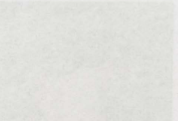
Una cantera de adoquines en Rodalquilar.