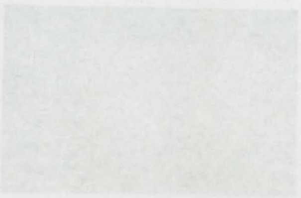
Una cantera de adoquines en Rodalquilar.