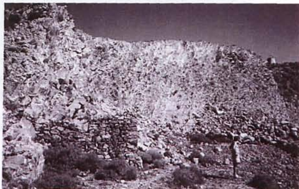
Figura 3. Panorámica de las labores de una cantera del cerro de Los Lobos, donde se pueden apreciar sus dimensiones comparativas con la persona de la imagen, situada en la explanada de la explotación.

década de 1940, cuando cesaron definitivamente sus trabajos (Estadística Minera y Metalúrgica de España). Su actividad fue irregular y alternaron periodos de actividad y periodos de paro, probablemente en función de la demanda de adoquines mas que por problemas de agotamiento de los yacimientos.