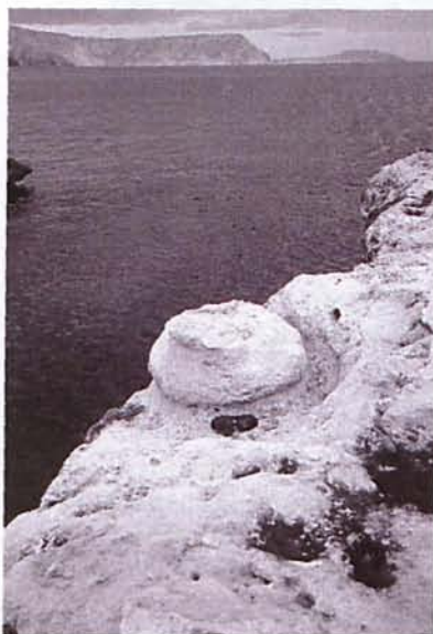
Figura 6. Panorámica del embarcadero donde atracaban las barcas para cargar adoquines y llevarlos hasta los mercantes.

En el caso del cerro de Los Lobos , el cable aéreo iba desde la cantera situada en la parte alta de la ladera, hasta la cala del Carnaje . En esta cala existía un embarcadero artificial construido de hierro y madera, justo en el centro de la ensenada y que hoy día ya no existe al haber sido destruido por la acción del mar. En este embarcadero, atracaban las barcas para cargar los adoquines y llevarlos a los mercantes que esperaban a distancia de la costa.