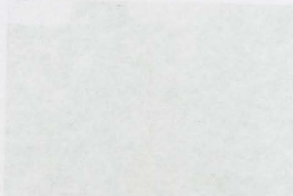
Alcubillas, Almería. Canchales de adoquines en Rodalquilar (Almería), en la primera mitad del siglo XX.