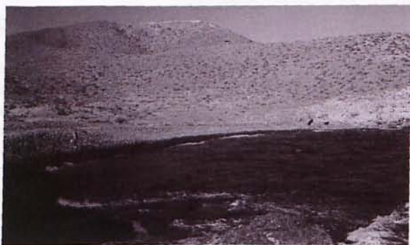
Figura 2. Zona de canteras del cerro de Los Lobos, vista desde la cala del Carnaje.

La segunda zona de canteras, que es además la más importante, se encuentra situada en el cerro de Los Lobos en su parte más cercana a la cala del Carnaje, desde donde también se puede observar algunas de las canteras, ya abandonadas hoy día.