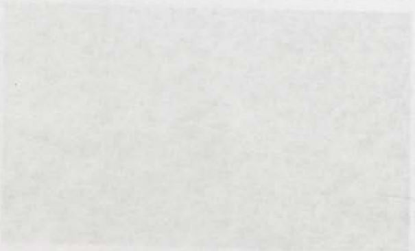
Una cantera de adoquines en Rodalquilar.