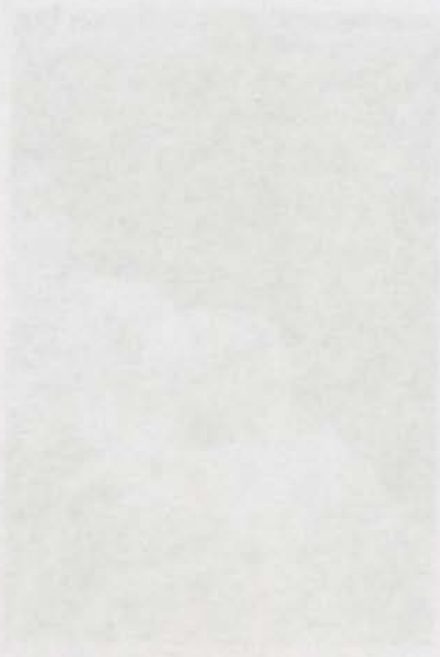
Alcubillas, Almería. Canchales de adoquines en Rodalquilar (Almería), en la primera mitad del siglo XX.

El canchal de Rodalquilar, en la zona de Alcubillas, Almería, fue utilizado para la extracción de adoquines en la primera mitad del siglo XX. Este tipo de canchales era común en la zona y se utilizaban para almacenar y transportar los adoquines extraídos de las canchales de Rodalquilar.