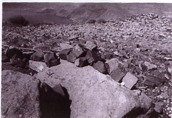
Figura 4. Adoquines abandonados en la misma cantera donde fueron labrados en su día. La moneda utilizada como escala, es una pieza de 100 pesetas del año 2000.

Los adoquines se labraban en la misma cantera y sus dimensiones más normales eran 25x14x14 centímetros (Estadística Minera y Metalúrgica de España. Año 1920). El hecho de presentarse en muchos casos en disyunciones columnares, facilitaba el labrado de los adoquines a pie de la misma cantera.