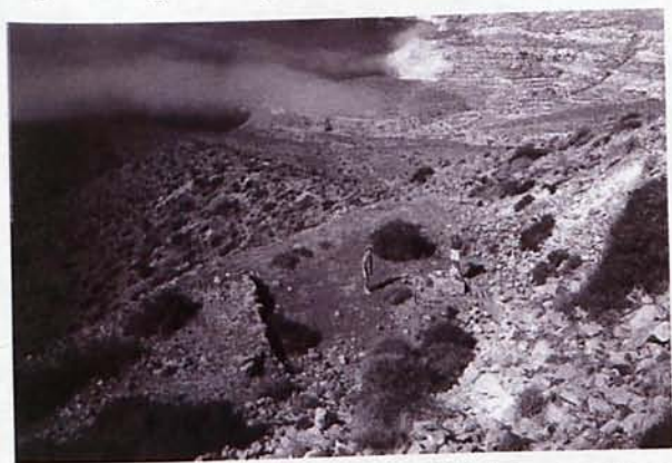
Figura 8. Punto de partida del cable aéreo en las proximidades de las canteras del cerro de Los Lobos. En el suelo se puede apreciar la bancada dónde se fijaba la infraestructura del inicio del cable. Al fondo se aprecia entre la niebla la cala del Carnaje, donde estaba el embarcadero para los adoquines

canteras de adoquines. Estas canteras, fueron explotadas de una manera similar a como se hizo con las de los alrededores del pueblo de Rodalquilar (estadística Minera y Metalúrgica de España).