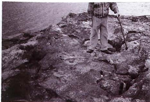
Figura 5. En el suelo se pueden apreciar restos de las fijaciones metálicas que existían en el punto de llegada del cable aéreo del cerro Romero.

En el caso del cerro Romero , el cable aéreo para el transporte de los adoquines, iba desde la cantera situada a media ladera, hasta la zona conocida como los Caletones del Playazo , donde existe un pequeño embarcadero artificial excavado en la roca que se conserva aun hoy. Una vez los adoquines estaban junto al embarcadero, se cargaban en barcas y se llevaban a los barcos mercantes que estaban esperando a ser cargados, en zonas de aguas mas profundas. Estos mercantes llevaban los adoquines a sus zonas de destino y distribución.