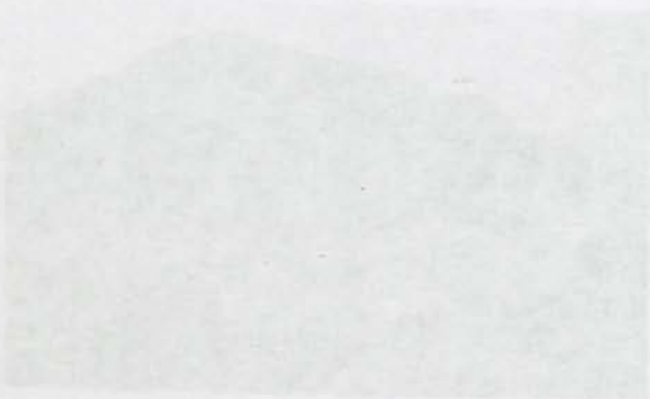
Una cantera de adoquines en Rodalquilar.