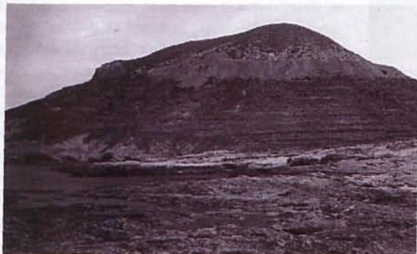
Figura 1. Zona de canteras del cerro Romero

La primera zona de canteras, esta situada en el cerro Romero, en su ladera cercana a la cala del Playazo, desde donde hoy día, aun se puede observar esta explotación abandonada.