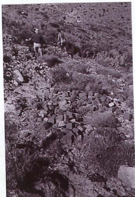
Figura 9 - Carga que perdió, en su día, uno de los contenedores con adoquines que transportaba el cable aéreo desde las canteras hasta el embarcadero de la cala del Carnaje.

canteras de adoquines. Estas canteras, fueron explotadas de una manera similar a como se hizo con las de los alrededores del pueblo de Rodalquilar (estadística Minera y Metalúrgica de España).