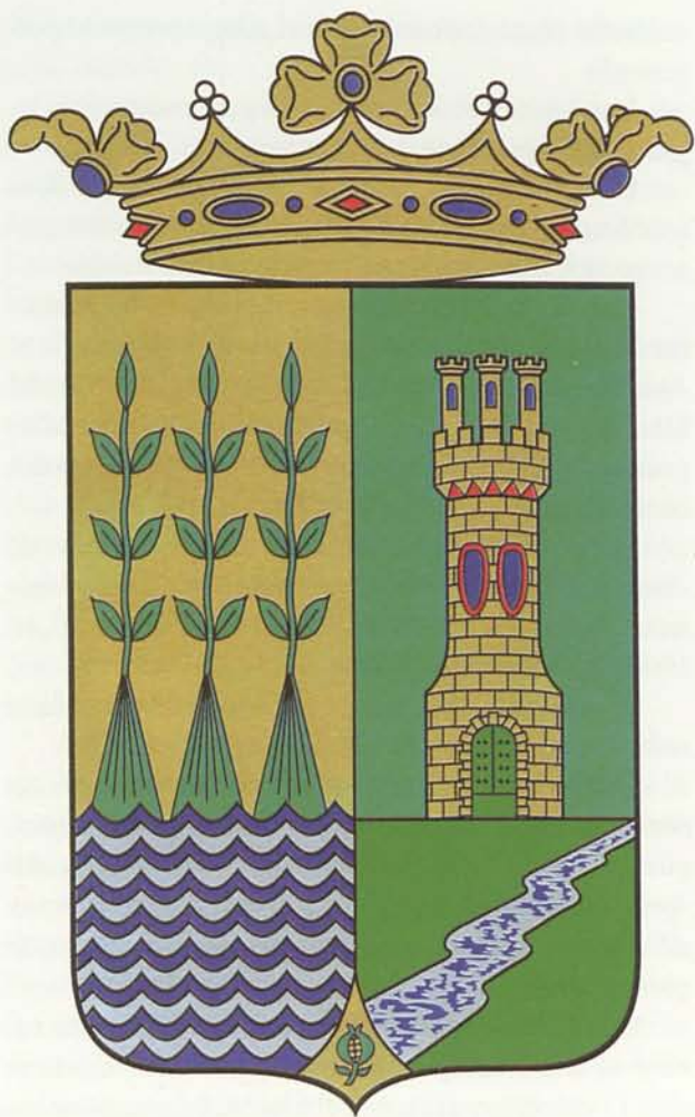
8. Blasón de Cuevas del Almanzora, aprobado.

Aconseja así mismo prescindir de la representación propuesta, realista, del castillo, y sustituirla por un castillo heráldico, según lo acostumbrado.