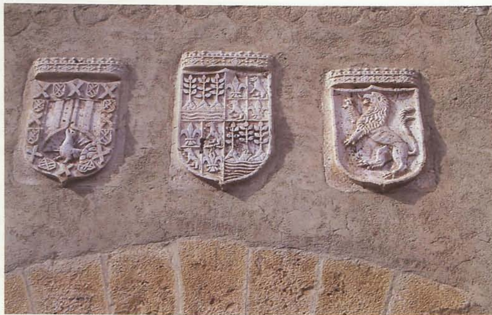
4. Frontispicio del castillo de Cuevas del Almanzora

de ser villa de realengo para pasar a ser villa de señorío por permuta que hicieron los reyes Católicos con don Pedro Fajardo, primer Marqués de los Vélez.