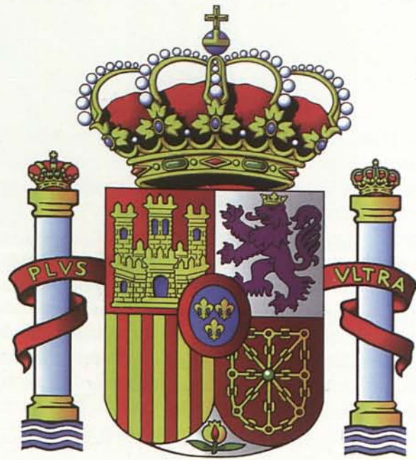
1. Escudo Nacional, entado en punta

Escudo formado por dos líneas que partiendo del centro del escudo, suben hasta los dos ángulos superiores de éste.