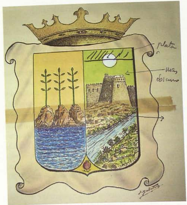
7. Dibujo-boceto del expediente