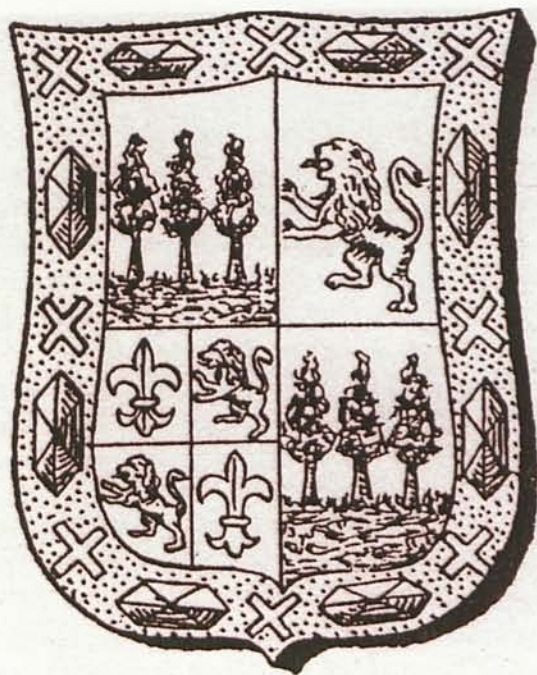
5. Armas de Cuevas de Vera en la Enciclopedia Espasa .

Como hemos podido ver, la dependencia de este consistorio municipal, hasta el siglo XIX, está total-