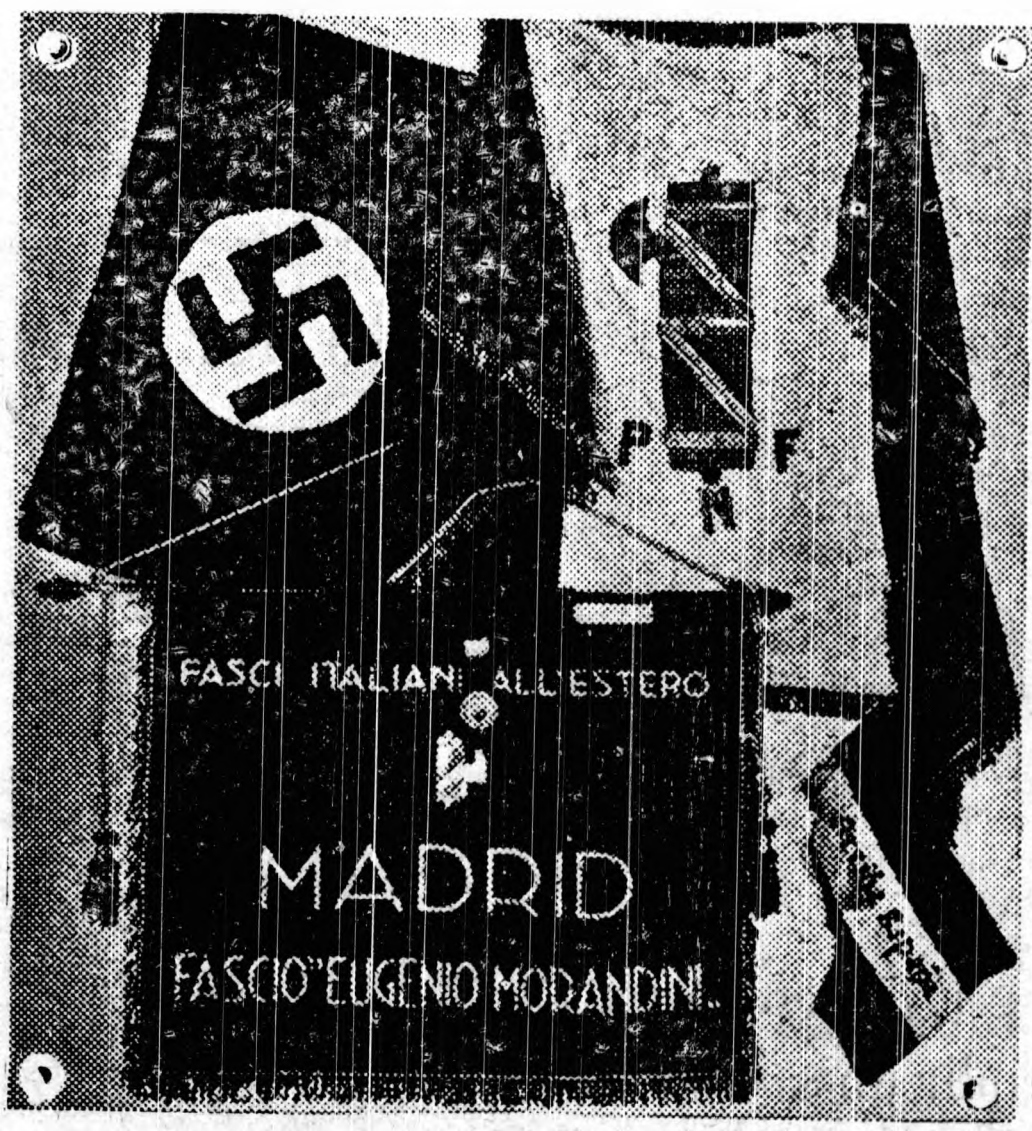
Banderines y estandarte tomados al enemigo en el frente Centro.

aras de la libertad que estamos dispuestos a defender con las uñas si fuera menester. Pero no es necesario recurrir a esto, nuestro Gobierno del Frente Popular a través del Ministro de Instrucción Pública, ha dicho, si el