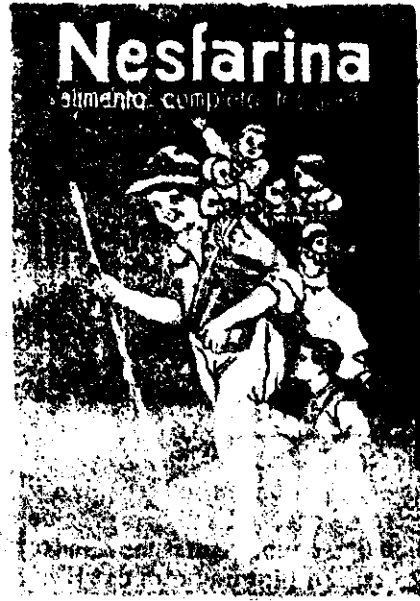
TIP. LA INDEPENDENCIA, ALMERIA.

Por decreto de 22 de Enero se admitió dicho registro mandando publicar los edictos, para que reclamaren los que se crean perjudicados.