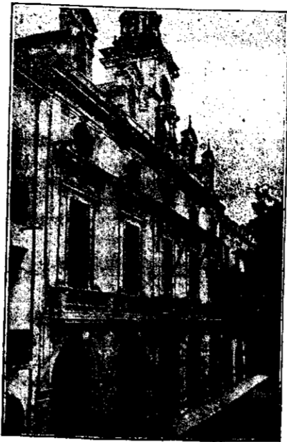
AYUNTAMIENTO FACHADA PRINCIPAL