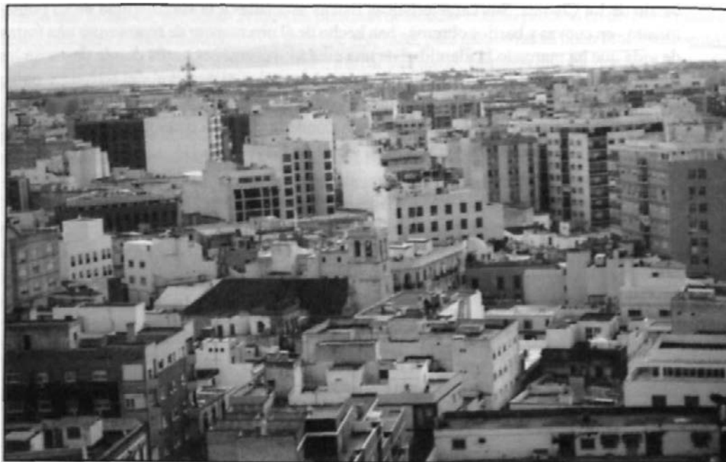
Figura 5. La Almería vertical desde el cerro de San Cristóbal.