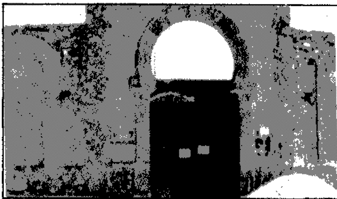
Plaza de Toros de Vera.

Las posteriores revisiones de los asuntos relacionados con el pabellón parecen estar más en la línea de cercenar el prestigio del Certamen (y, por ende, del régimen primoriverista) que de aclarar un asunto en el que podía existir malversación de fondos provinciales.