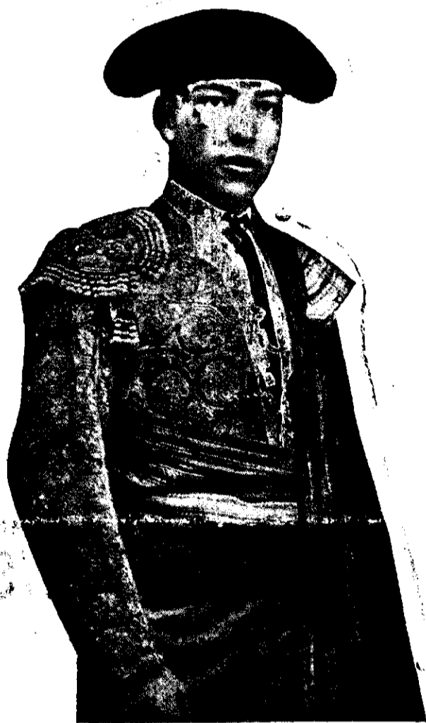
El valiente novillero almeriense «Guerrero» que ha terminado brillantemente la temporada y del que la afición espera un «as» de la tauromaquia

La hermosa pluma de nuestra paisana Colombine, de la preclara escritora Carmen Burgos Seguí ha escrito magistralmente estos pa-