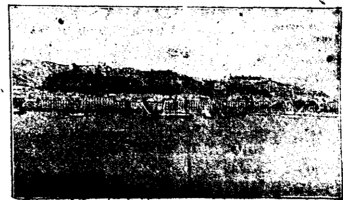
LA ALCAZABA.—Vista desde la bahía