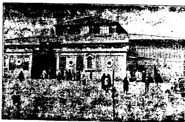
Fachada posterior del Mercado