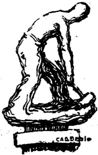
Estadua del Trabajo

Vaya pues desde aquí, un sincero aplauso que sirva como humilde ofrenda de almerienses agradecidos, al hombre que con su industria, dió a la ciudad, aspecto de ciudad moderna y elegante.