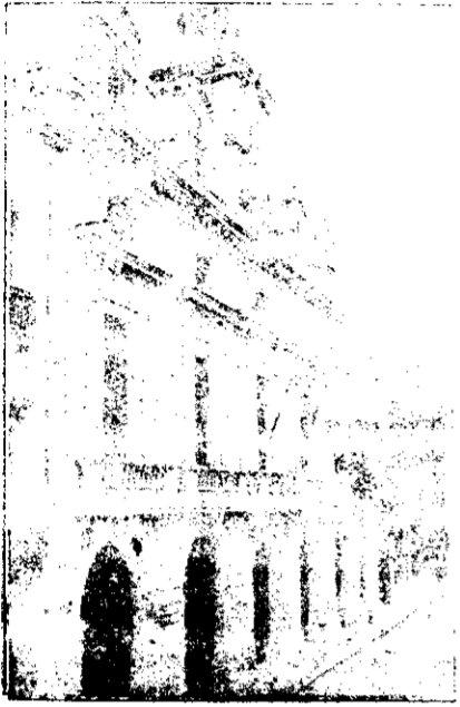
Fachada principal del Ayuntamiento