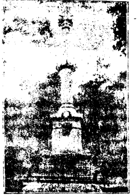
Obelisco a los Mártires de la Libertad