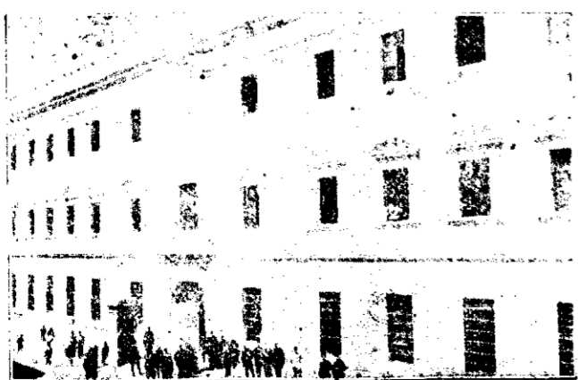
Fachada del Cuartel de la Misericordia

Compra-Venta de sacos usados Silencio, 38 Almería.