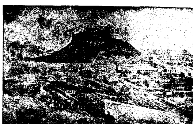
Almería.—VISTA DE LA ALCAZABA