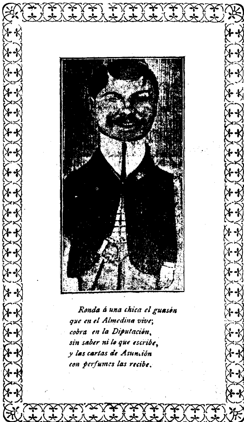
Ronda á una chica el guason que en el Almedina vive, cobra en la Diputación, sin saber ni lo que escribe, y las cartas de Asunción con perfumes las recibe.