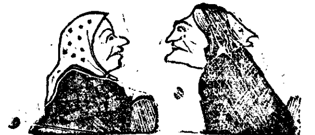
DE TODO UN POCO.

Por cierto que á consecuencia de ese abrazo, me quiso después como si me hubiera parido.