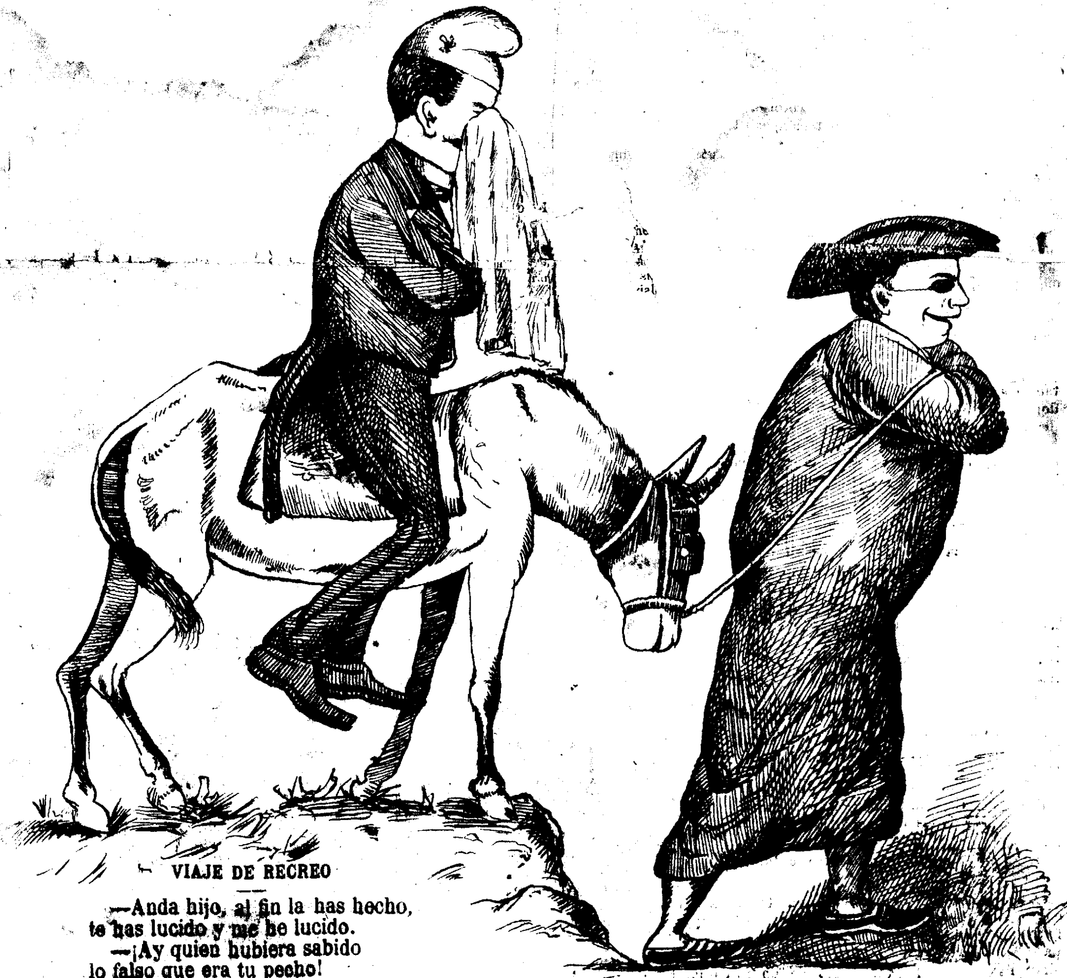
VIAJE DE RECREO

—Anda hijo, al fin la has hecho, te has lucido y me he lucido. —¡Ay quien hubiera sabido lo falso que era tu pecho!