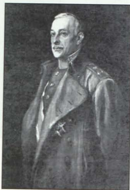
General Primo de Rivera

Los grupos de la conjunción repu- blicano-socialista inician una etapa de actividad desenfrenada