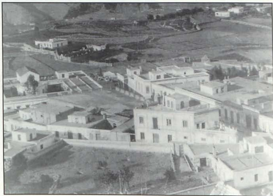
Vista parcial de Alhama

Alhama perdió en sólo veinte años más de 1.500 personas