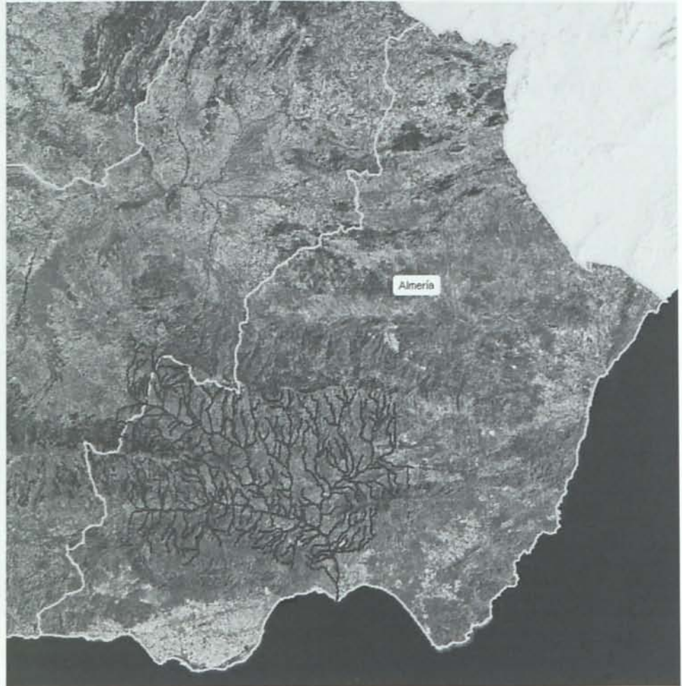
Cuenca hidrográfica del río Andarax.

suelo. En general, las fuentes se situaban dentro del cauce del río, y eran galerías de drenaje abiertas en terrenos de acarreo y revestidas de mampostería ordinaria en las partes más antiguas y de piedra de sillería, en seco, las paredes y las bóvedas de las más modernas. A través de las arenas y los cantos rodados las aguas fluían a las galerías a modo de un vaso colector, filtrándose por las juntas y por los intersticios de los sillares de sus paredes y bóvedas.