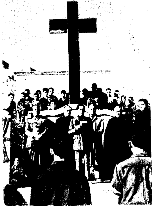
El Delegado Local del Frente de Juventudes durante la lectura del Testamento de José Antonio Primo de Rivera.