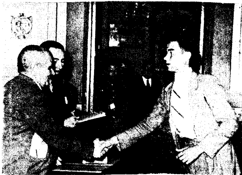
El Presidente de la Hermandad de Labradores y el Director del Centro entregando uno de los premios a un cursillista.