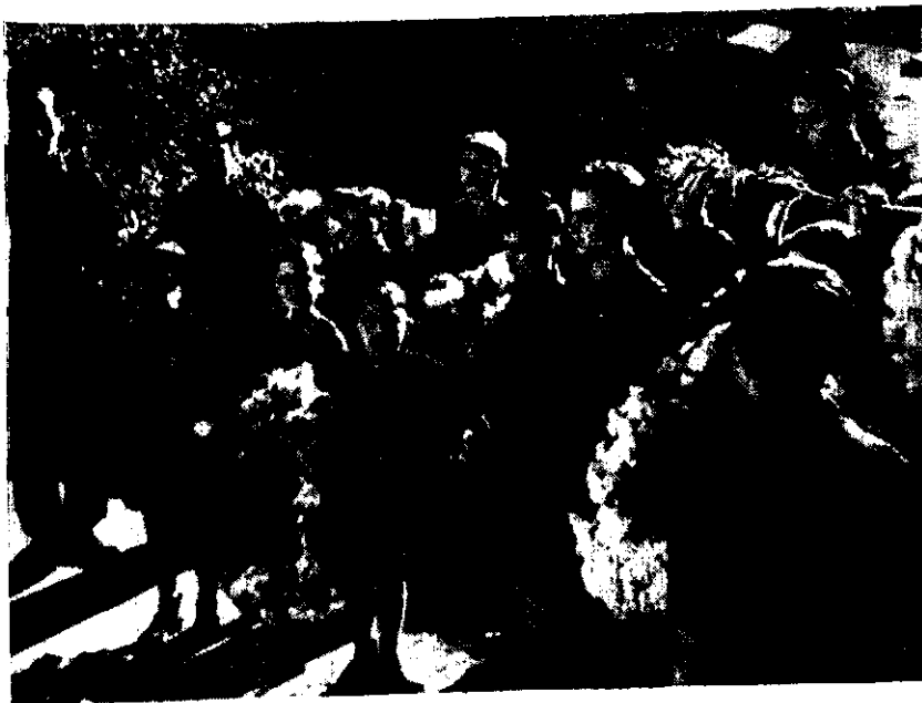
Camaradas del F. de J. ante la Cruz de los Caídos portando las coronas para su ofrenda.

En el Hogar Rural del Frente de Juventudes y para recibir dignamente a la Santa Virgen de Fátima, se levantó un artístico altar en el que simulando la aparición de la Virgen, se llevó a cabo una perfecta obra de arte y buen gusto, en la que colaboraron la Sección Femenina y camaradas de las Falanges Juveniles de Franco. Portaron éstas, durante el recorrido procesional, las andas del trono de dicha imagen, prestando servicio de guardia durante todo el tiempo que estuvo expuesta en nuestro Hogar.