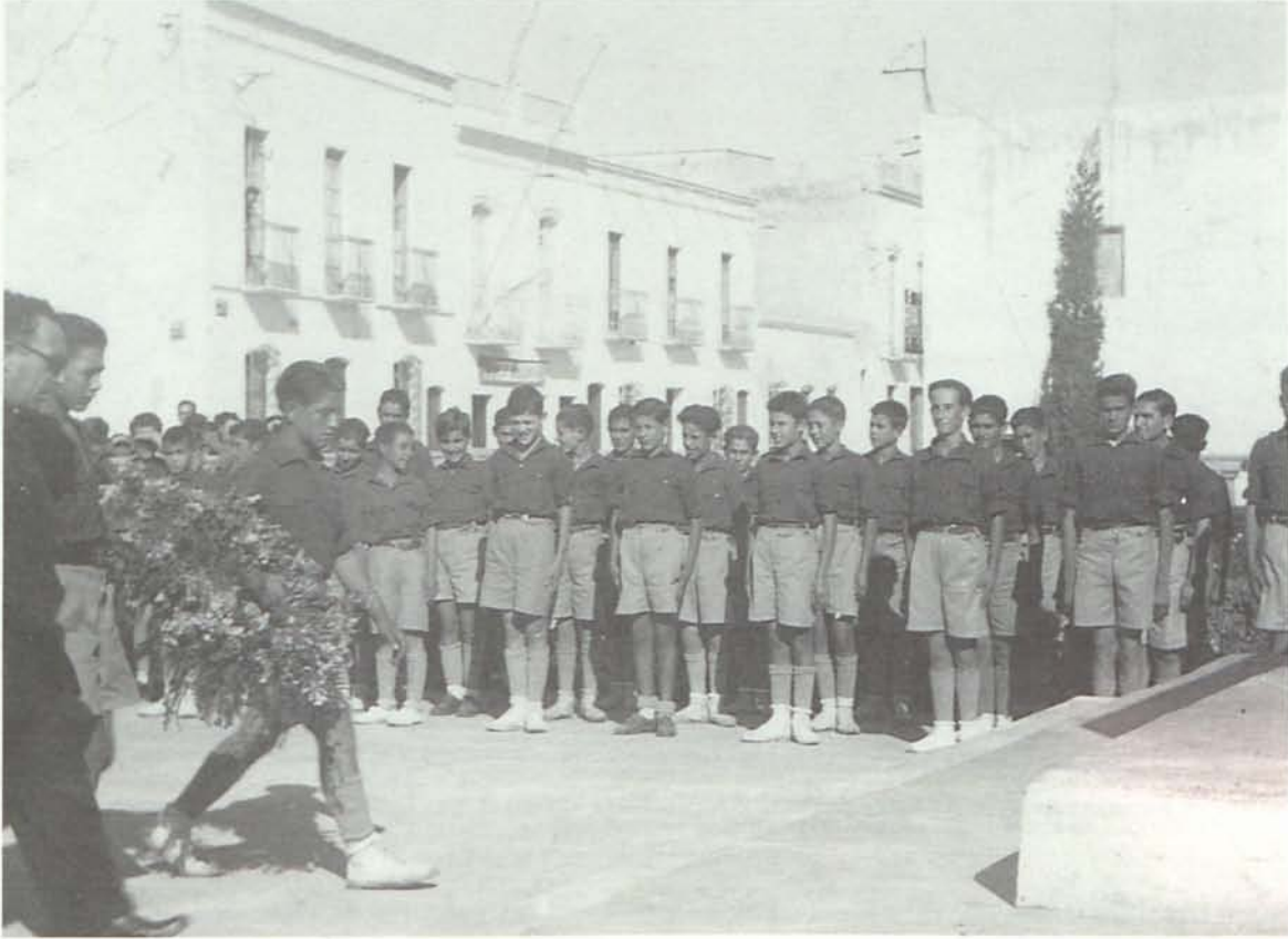
10. Acto del Frente de Juventudes en la Cruz de los Caídos, donde se depositan ofrendas de flores.

des, dos pantalones cortos, un jersey de montañero, un par de botas, dos calcetines blancos de lana, un par de alpargatas con suela de yute o cáñamo, un pantalón corto para deporte, un bañador, una manta o saco de dormir, una toalla, una bolsa de aseo personal, una caja de grasa para engrasar el calzado y las correas del morral. El menaje se componía de un plato o fiambra de aluminio, un cubierto, un vaso de aluminio, una cantimplora, una navaja de monte con punzón, un abrelatas, dos bolsas de tela para los víveres a granel, un bloc para notas, un lapicero y tarjetas y sellos para escribir. Lo mejor para los jóvenes garrucheros que participaban es que tenían la comida asegurada. Entre los víveres del campamento abundaban productos poco usuales para la época: arroz, tocino, chocolate, especias, pan de higo, carne de membrillo, chorizo, mermelada, aceite, azúcar o jabón. A pesar del denigrante señuelo propagandista que tenía la organización, surgían también brotes de utilidad de toda aquella parafernalia de gestos rimbombantes y patrioterros como el caso de los concursos de oficios que se desarrollaban entre los adscritos, para promover el desarrollo agrícola y ganadero. En este contexto, el Frente desarrollaba certáme-