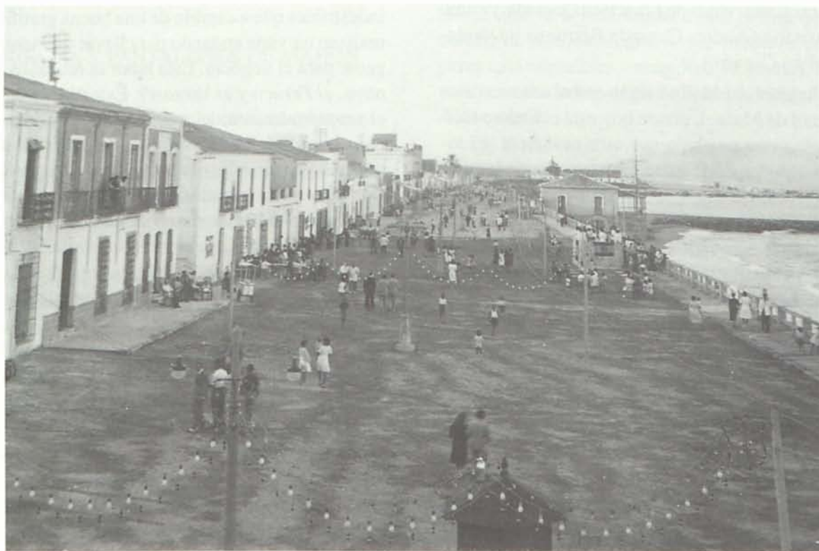
5. El Malecón adornado con lamparillas durante las Fiestas de Agosto de la postguerra.