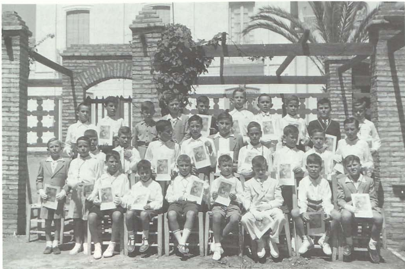
2. Niños de comunión en la plaza de la Ermita, a finales de los cuarenta.