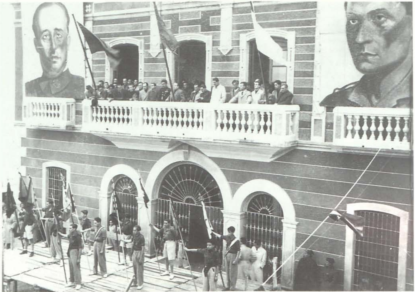
4. El Gobernador Civil presidiendo un acto en la puerta del Ayuntamiento de Garrucha con motivo de la inauguración de unos locales del Frente de Juventudes (Fotografía de Miguel Forteza. Col. Juan Grima).

guerra de Abisinia. Era un artefacto en forma de caldera que se adosaba a la parte trasera de los vehículos y en el que se procedía a la combustión de toda clase de materiales susceptibles de arder y conferir una mezcla rica en hidrocarburos como las cáscaras de almendra o troncos de olivo. También reaparecieron los viejos coches de caballos. Era tanta la penuria que los pescadores cambiaban la gasolina racionada que les correspondía para las lámparas de sus barcas por alimentos del campo. En esa tesitura, el Malecón apenas estaba iluminado por cuatro faroles sometiendo a las noches de invierno a la más absoluta oscuridad. En las casas se tuvieron que desempolvar los viejos quinqués y las mariposas de aceite y para calentarse en las frías noches. Era un lujo poder contar con una bombilla pelada de la que salía un cable rizado clavado en la pared de cal, que terminaba en un interruptor de porcelana. Aunque en una región de clima benigno, las familias hacían acopio del picón, a cuya lumbre se arrullaba la familia entera antes de ir a acostarse sobre camastros de perfolia. El tópico de la pertinaz sequía , que comenzó a acuñarse en el año 43, provocó, incluso en un