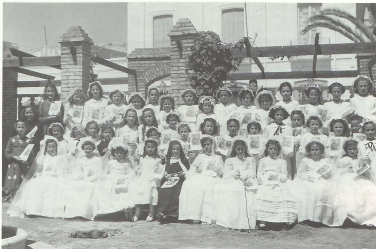
1. Niñas garrucheras con el traje de comunión en la plaza de la Ermita, a finales de la década de los cuarenta.