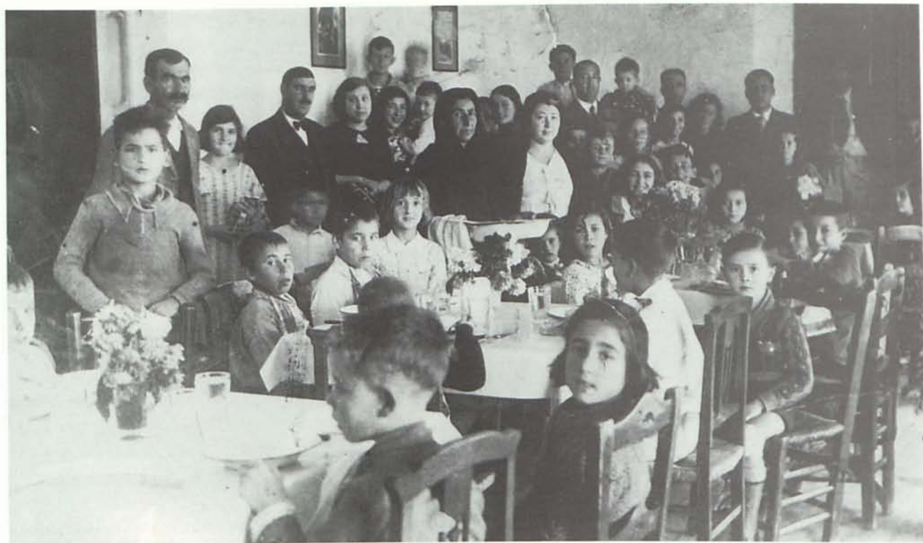
3. Alumnos y maestros de las Escuelas Graduadas de Garrucha un año antes de la Guerra Civil, tomando un refrigerio en el Pósito de Pescadores.

de penurias. El garruchero se vio forzado a ser un anfibio, a respira por branquias mezclando en su piel aceitunada el sudor, el salitre y el olor a estopa y a cáñamo. Hubo quien ante el hambre viva no le quedó otro escape que la emigración. Si antaño fue el Oranero o los transatlánticos americanos la puerta por donde muchos garrucheros del siglo XIX habían emigrado a ganarse el pan, ahora buscaban su futuro en fábricas de Toulouse y Perpignan o navegando en Tarragona.