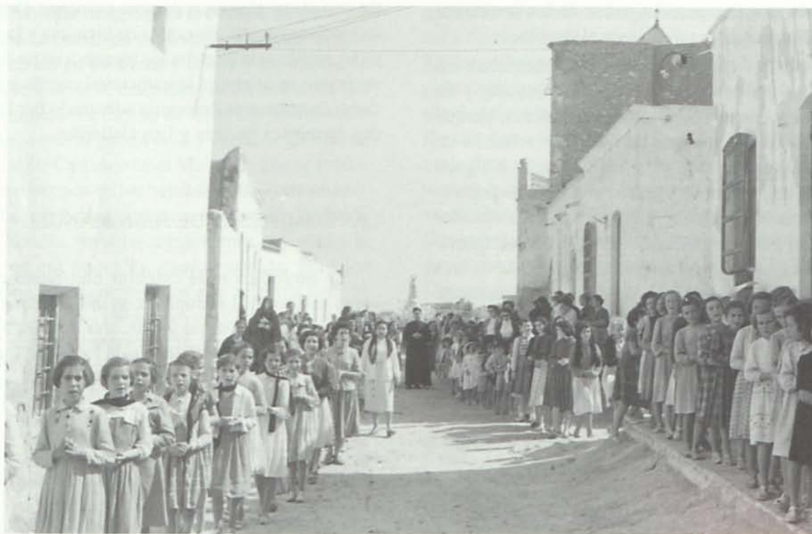
17. Procesión de niñas al lado de la Iglesia. Las calles aún eran de tierra.