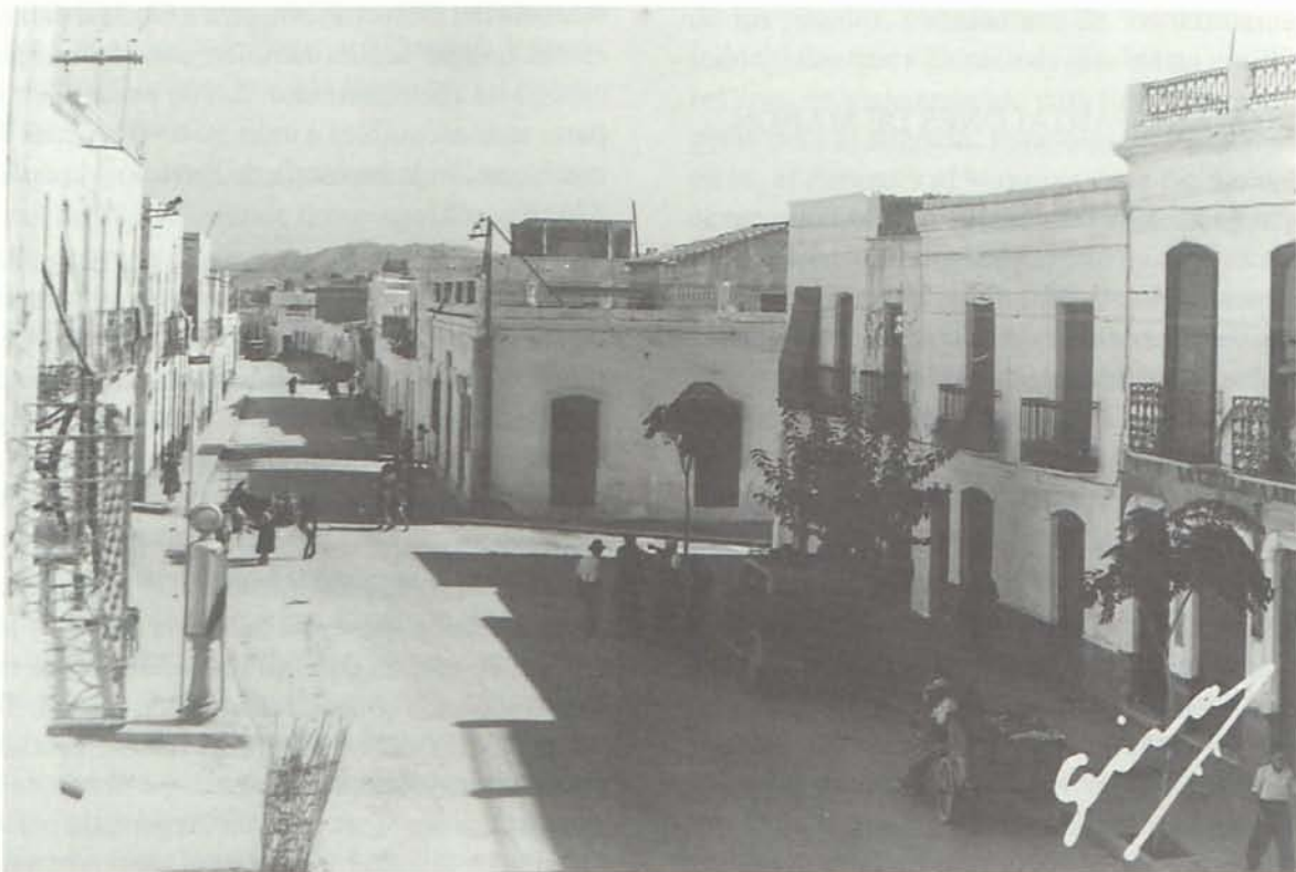
7. La calle Mayor de Garrucha en la postguerra. Aún se pueden observar mulas y burros utilizados para el transporte y las labores domésticas.