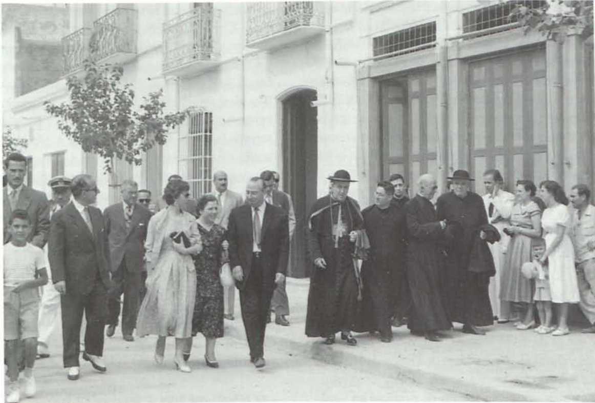
16. El obispo y otros sacerdotes de visita por la calle mayor de Garrucha con motivo de la bendición de una nueva imagen.

proyectaban había apercebimientos de la Censura y el Cine Español de Antonio González el Porreras recibió propuesta de sanción por haber pasado Gilda , paradigma del pecado en aquel tiempo. Todo estaba empapado de una religiosidad extrema y casposa, desde las enciclopedias escolares hasta los rosarios sin fin, la hora del Ángelus y el Ave María Purísima. La mirada atenta del sacerdote también velaba que se respetase la distancia decente en los bailes agarrados de Los Arcos, en la Feria o la letra de los adagios junto al Ayuntamiento. En esa época el más ínfimo desliz era pecado y podía arruinar la reputación de cualquier moza del lugar.