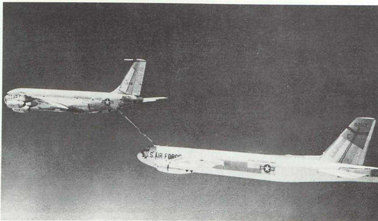
Bombardero B-52 repostando en pleno vuelo de su avión «nodriza», un KG-135

accionaron la palanca de eyección y un cuarto, Rooney, saltó por la escotilla de emergencia; los otros tres cayeron a tierra con el aparato muriendo por efectos del impacto. Los paracaídas de color naranja y blanco de los cuatro aviadores se abrieron y fueron impelidos por un fuerte viento de unos 60 nudos que soplaba del noroeste. Buchanan cayó en tierra mientras que Messinger, Wendorf y Rooney lo hicieron en el mar. Las cuatro bombas de hidrógeno, sostenidas por paracaídas automáticos de color gris se desplazaron a tierra al mismo tiempo que lo habían hecho los aviadores.