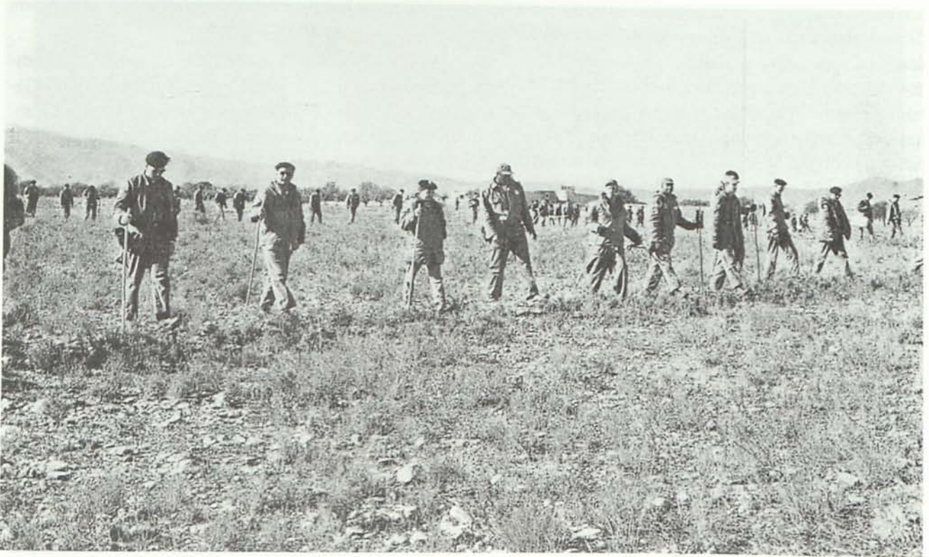
Aviadores norteamericanos rastreando el lecho seco del río Almanzora, cerca de Palomares. Van provistos de cañas de bambú, contadores Geiger y detectores de partículas Alfa, y buscan las bombas H desaparecidas.