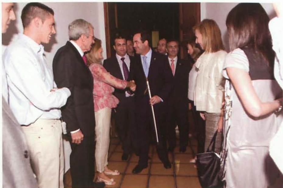
La familia de Salmerón recibe al señor Bono acompañado de otras autoridades.

Uno de sus hijos, Exoristo, diría: Mi padre nos legó algo que vale más que todas las fortunas y todas las propiedades, un nombre inmaculado y una senda que seguir.