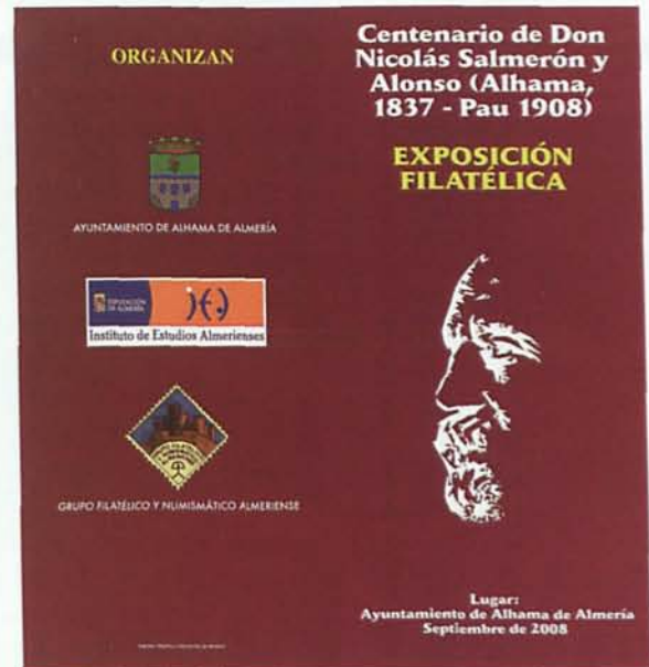
Folleto exposición filatélica celebrada en Alhama.

Una estafeta colocada en la entrada de las dependencias del Ayuntamiento durante la mañana del día 20 permitió a todos los alhameños que hasta allí se acercaron enviar sus cartas y tarjetas postales con este sello personalizado junto con el matasellos realizado para tal fin en el que se recogía la efeméride que conmemorábamos. Fue sin duda una actividad que despertó el interés del público que aguardó pacientemente largas colas para poder enviar, o autoenviarse, cartas o tarjetas convertidas así en un documento único para el recuerdo de esta fecha memorable para el pueblo de Alhama.