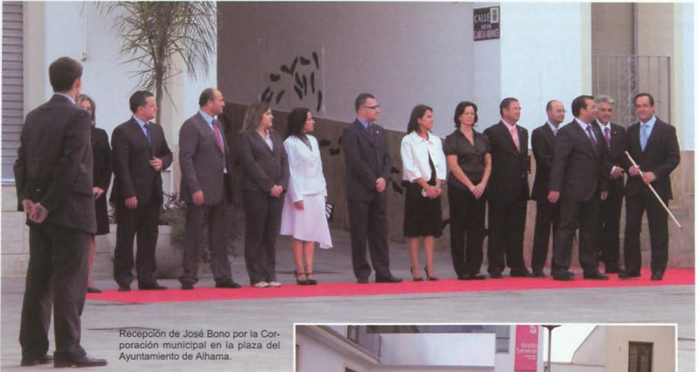
Recepción de José Bono por la Corporación municipal en la plaza del Ayuntamiento de Alhama.