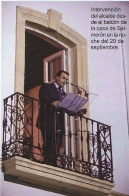
Intervención del alcalde desde el balcón de la casa de Salmerón en la noche del 20 de septiembre.

Ya no sólo serás recordado en Alhama. Los que hoy estamos aquí, llegados de toda España, daremos debida cuenta de tu mensaje y de tu honradez. Esto nos hará sentirnos más cerca de ti, como si nos reuniésemos todas las tardes a conversar aquí en el Paseo o la Huerta de Rosalía y, tras unas palabras de reflexión, llegásemos de nuevo a casa y a la vida cotidiana, enriquecidos de tu personalidad.