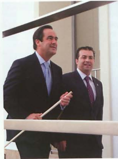
El Presidente del Congreso junto al Alcalde.

hombre y mujeres, la mayoría vecinos de Alhama, que no faltaron a la cita para homenajear a su paisano universal. El frontón en su interior se encontraba acondicionado ya desde la mañana para la ocasión.