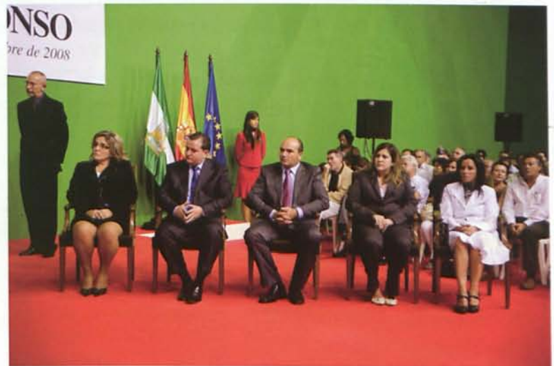
El grupo municipal Socialista durante la celebración del Pleno extraordinario en la tarde del 20 de septiembre.