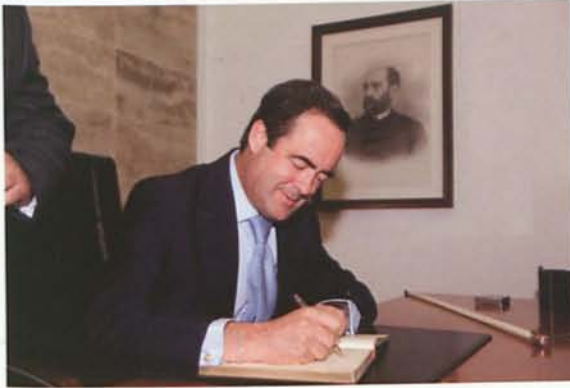
Firma en el Libro de visitas del Ayuntamiento.