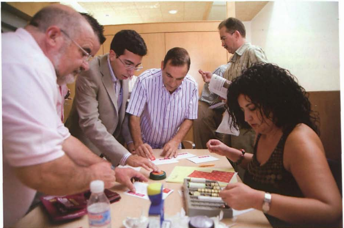
Muchas personas se acercaron a la estafeta para franquear sus cartas.