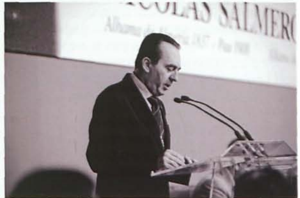
D. Ángel Díaz, diputado portavoz del Partido de Almería.