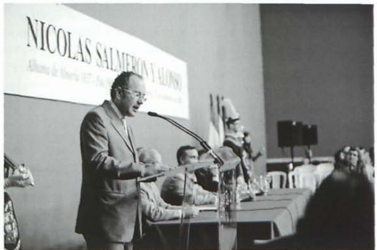
El diputado portavoz del grupo del Partido Popular, señor Fernández Amador, durante su intervención.