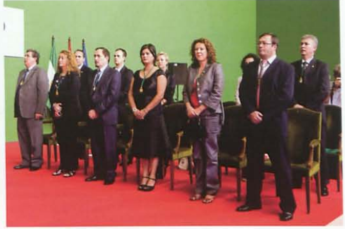
Señores diputados del grupo del Partido Socialista durante la celebración del Pleno extraordinario.