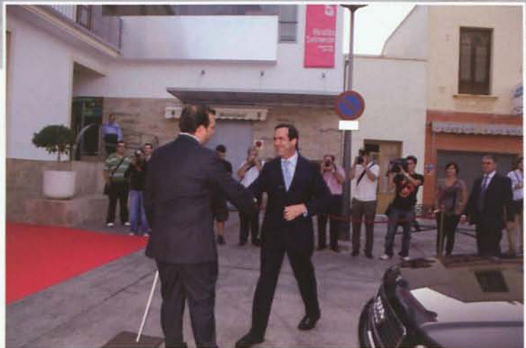
Llegada de D. José Bono, Presidente del Congreso de los Diputados al ayuntamiento de Alhama de Almería.