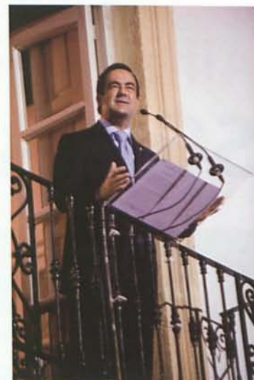
El Presidente del Congreso, Sr. Bono se dirige al pueblo de Alhama desde el balcón de la casa de Salmerón.

Un vino español en la Huerta Rosalía, que ofreció el Ayuntamiento a todos los asistentes, puso fin a un día histórico para Alhama.