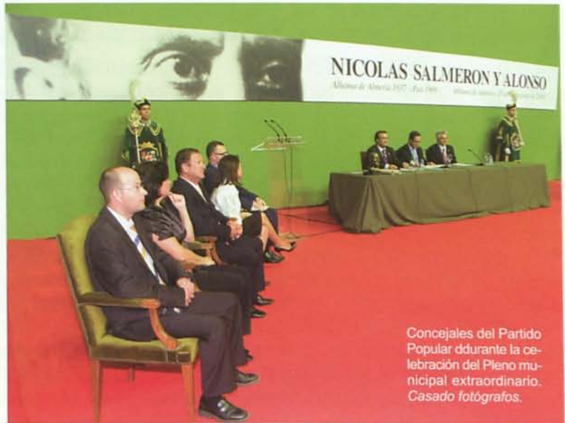
Concejales del Partido Popular durante la celebración del Pleno municipal extraordinario.

Su discurso terminó con un párrafo muy emotivo. Dijo: Para todos ellos y para nosotros Salmerón fue la grandeza de espíritu, fue la elevación del pensamiento, fue la virtud purificada. Para todos ellos y para nosotros Salmerón es Alhama y Alhama es Salmerón. Por ello, ciudadanos y ciudadanas, hoy podemos decir que