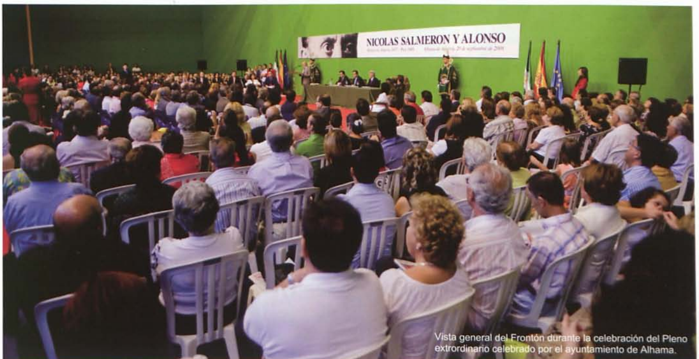
Vista general del Frontón durante la celebración del Pleno extraordinario celebrado por el ayuntamiento de Alhama.