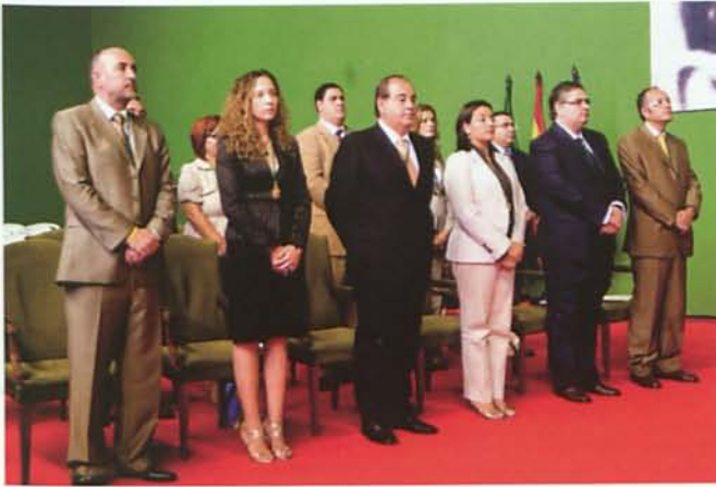
Señores diputados del grupo del Partido Popular durante la celebración del Pleno extraordinario.