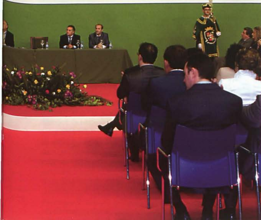
Pleno extraordinario de la Diputación de Almería.

Alhama de Almería 1837 – Pau 1908 Alhama de Almería, 20 de septiembre de 2008